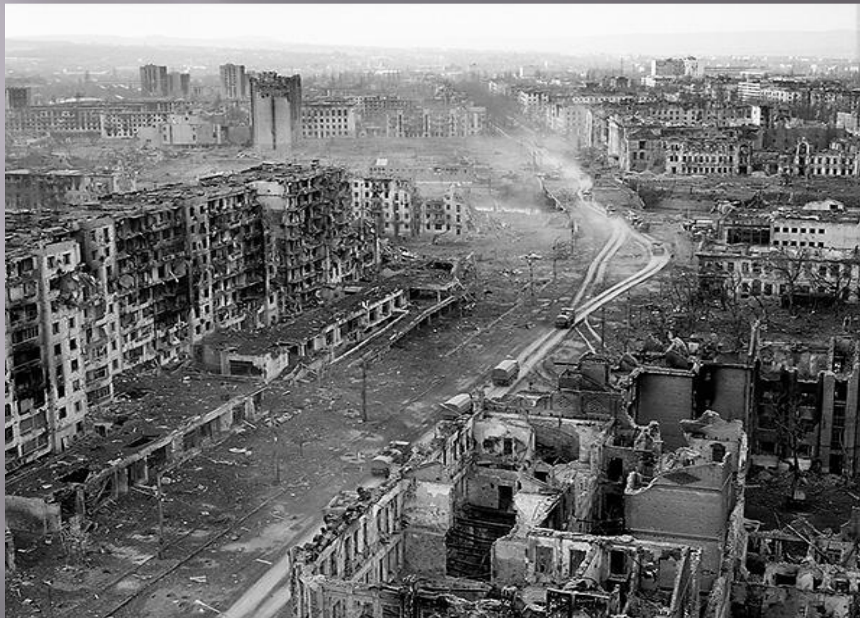
Разрушенный город Грозный.