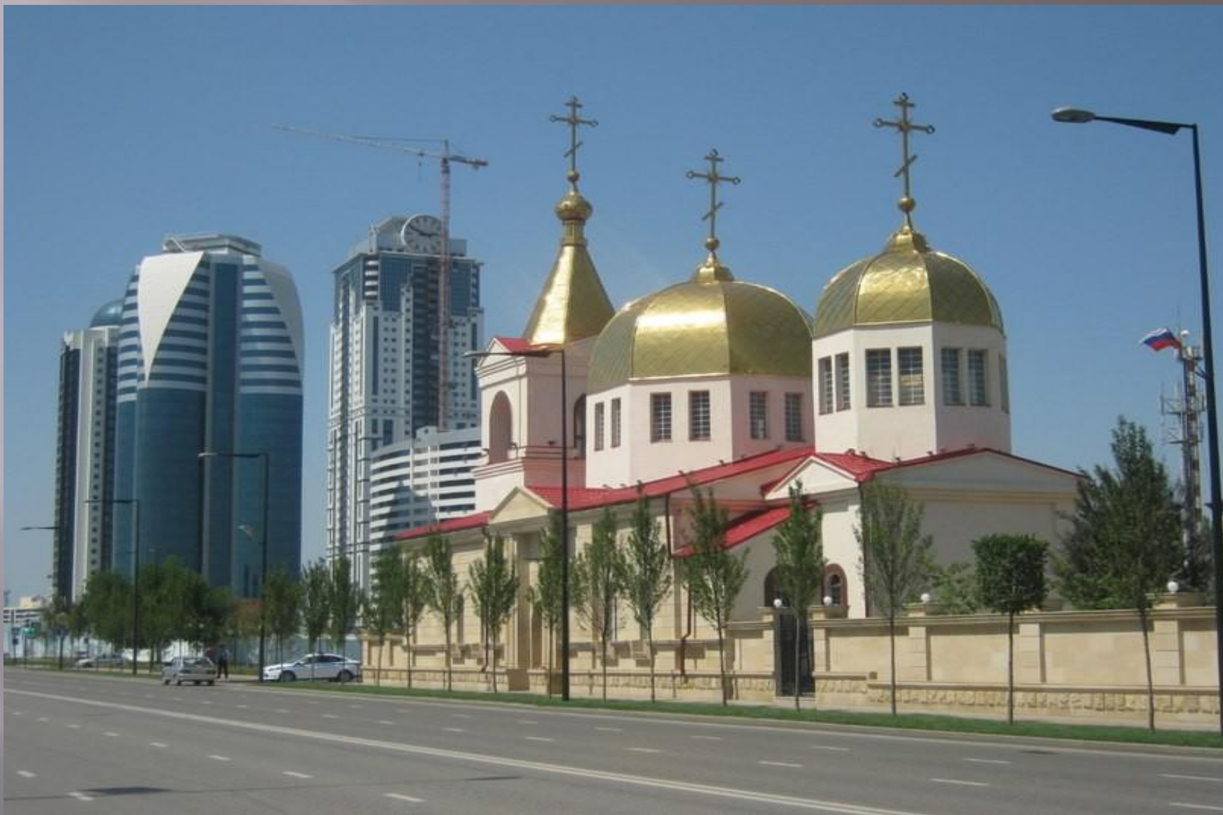
Православный храм в центре Грозного- Церковь Михаила Архангела.