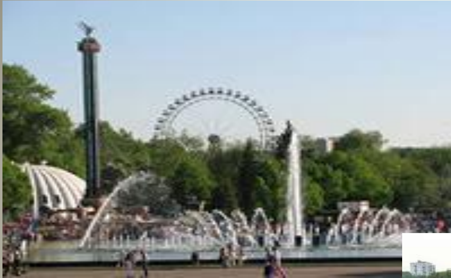
им. Горького Центральный парк