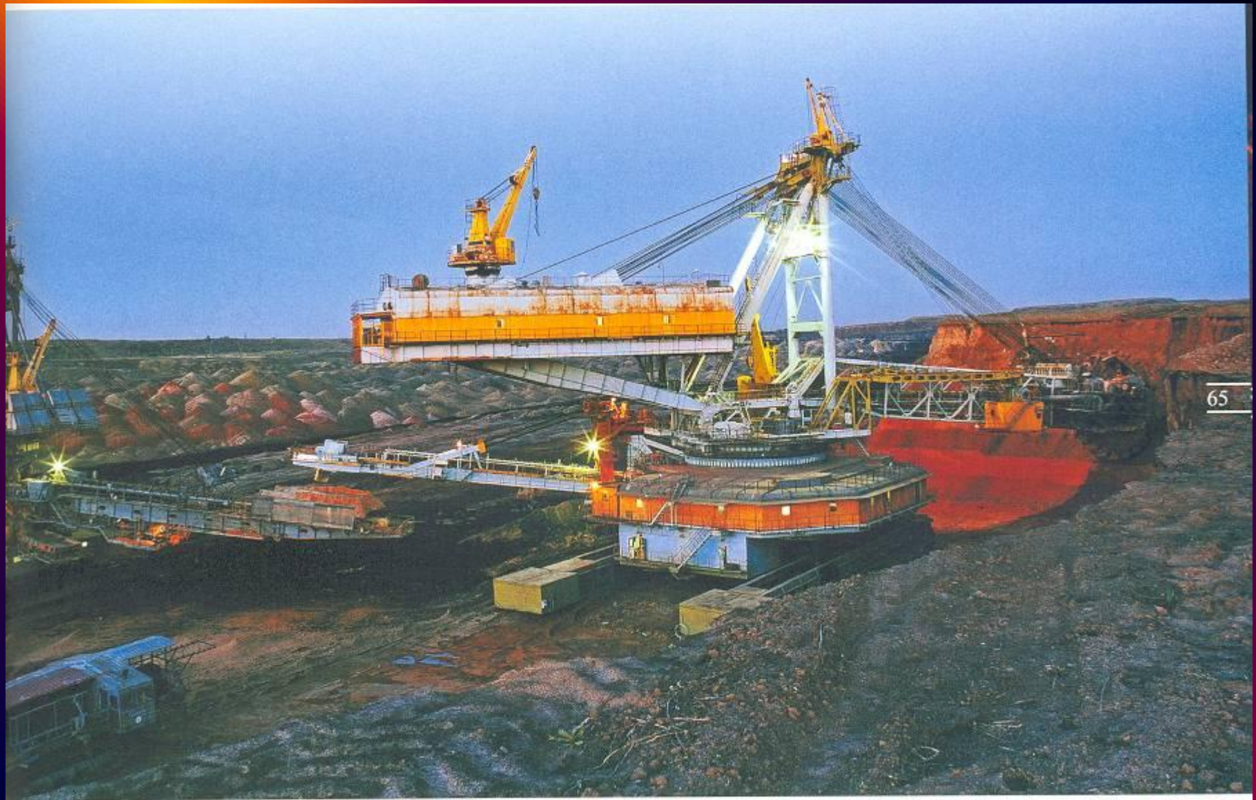
Добыча каменного угля открытым способом