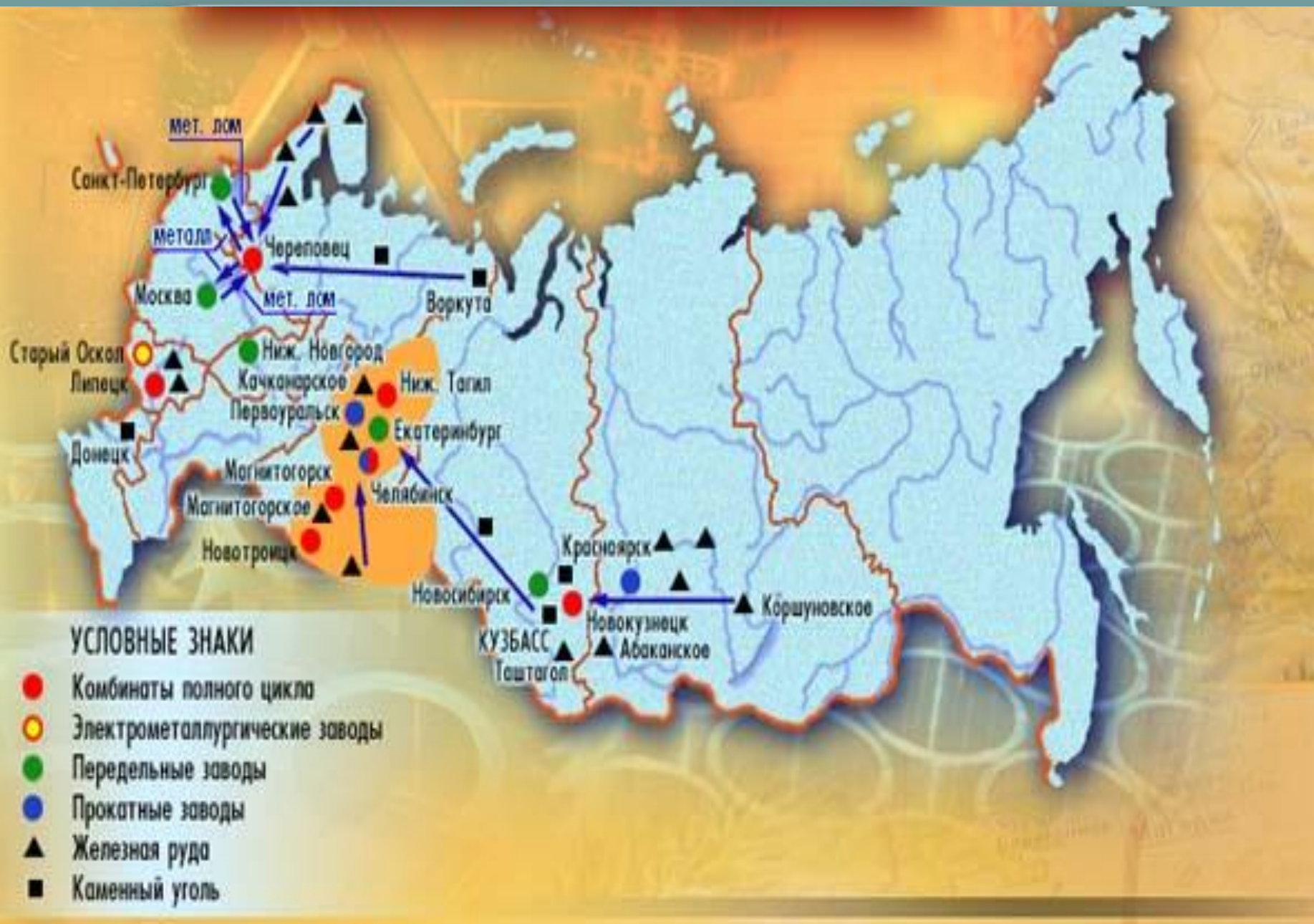
География черной металлургии России