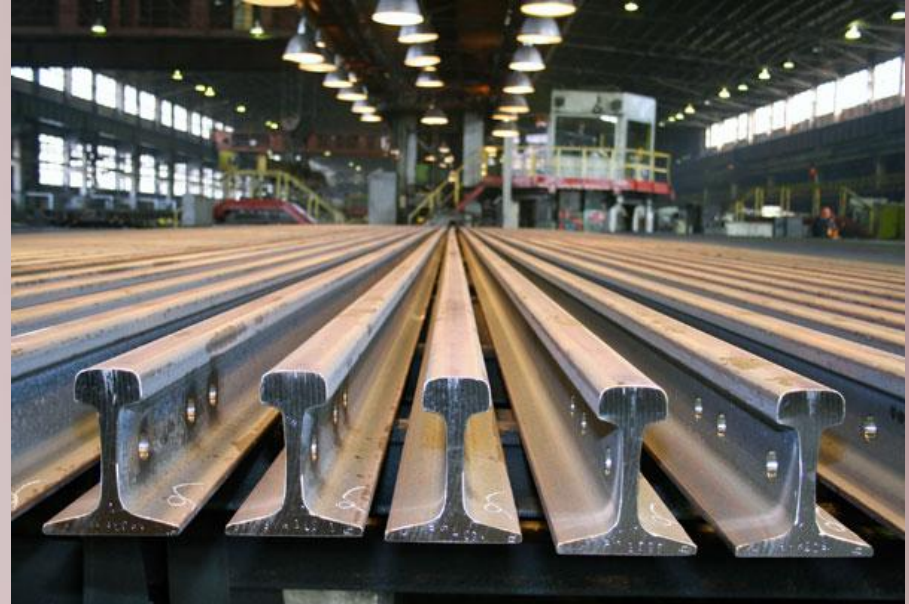
В рельсобалочном цехе Новокузнецкого металлургического комбината