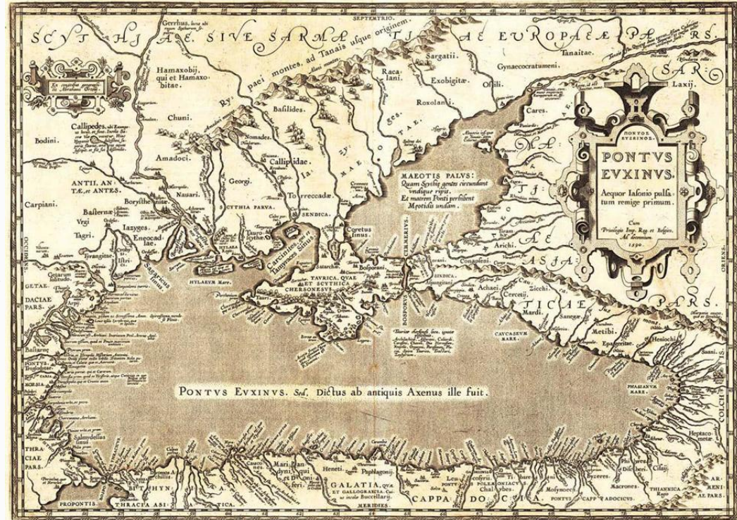
Карта Чёрного моря 1590 год

Огромные массы солёной средиземноморской воды устремились в котловину Чёрного моря, вызывая гибель огромного количества пресноводных обитателей. Их погибло так много, что разложение остатков их организмов в глубине моря, лишённой кислорода, создало тот первоначальный запас сероводорода, который продолжает существовать до сих пор. Чёрное море стало «Морем мёртвых глубин».