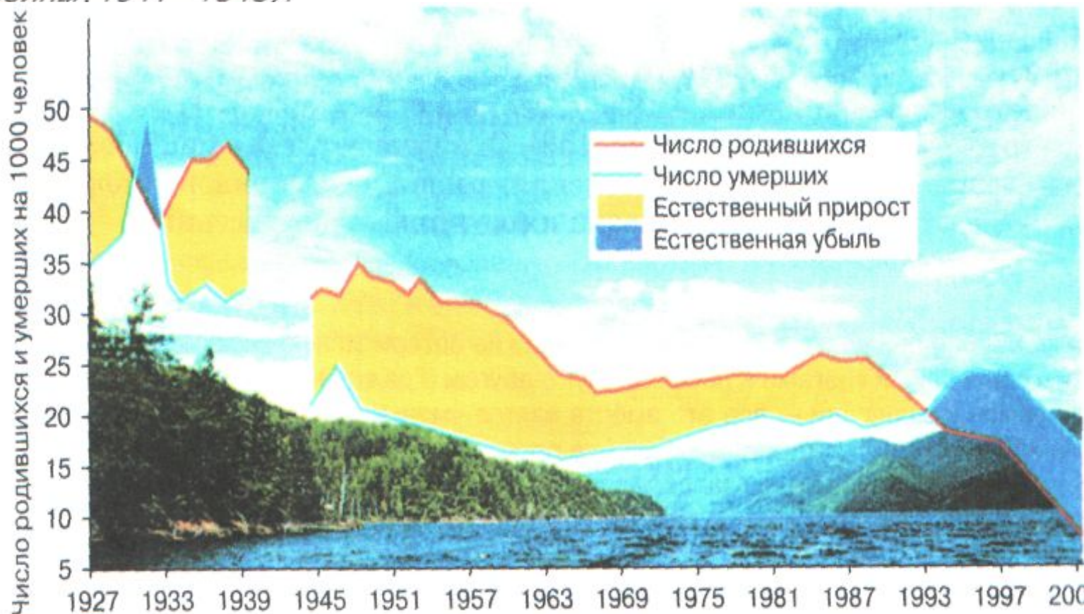
Рис. 172. Естественное движение населения России (по Е. М. Андрееву, Л. Е. Дарскому, Т. Л. Харьковской)

2. На какие годы приходятся критические периоды в естественном движении населения? Почему на графиках нельзя достоверно отразить период Великой Отечественной войны (1941–1945)?