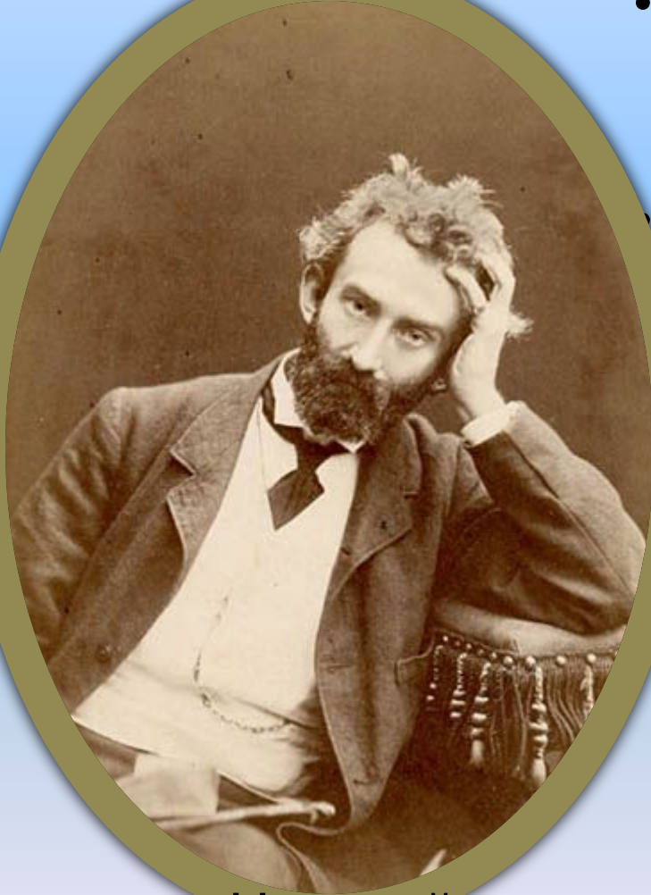
Николай Николаевич Миклухо-Маклай