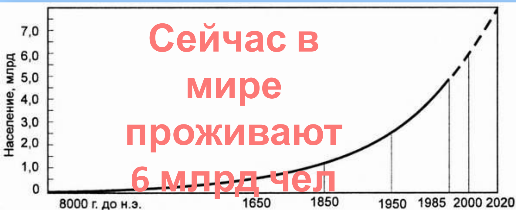
Рис. 10.1. Рост населения в мире