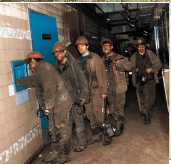
Численность безработных, состоящих на учете в органах государственной службы занятости на конец сентября 2006 года