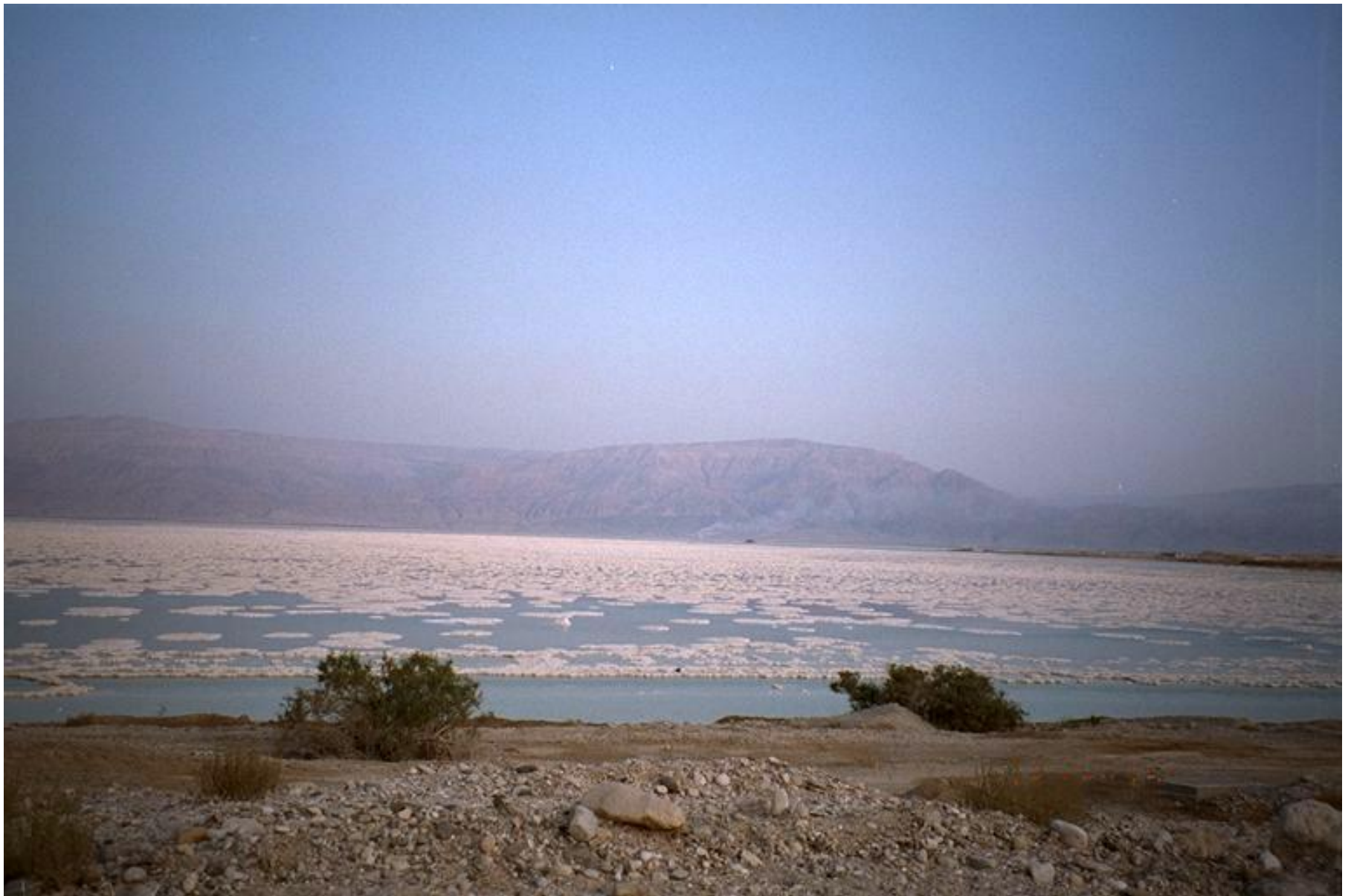
Мёртвое море, Израиль