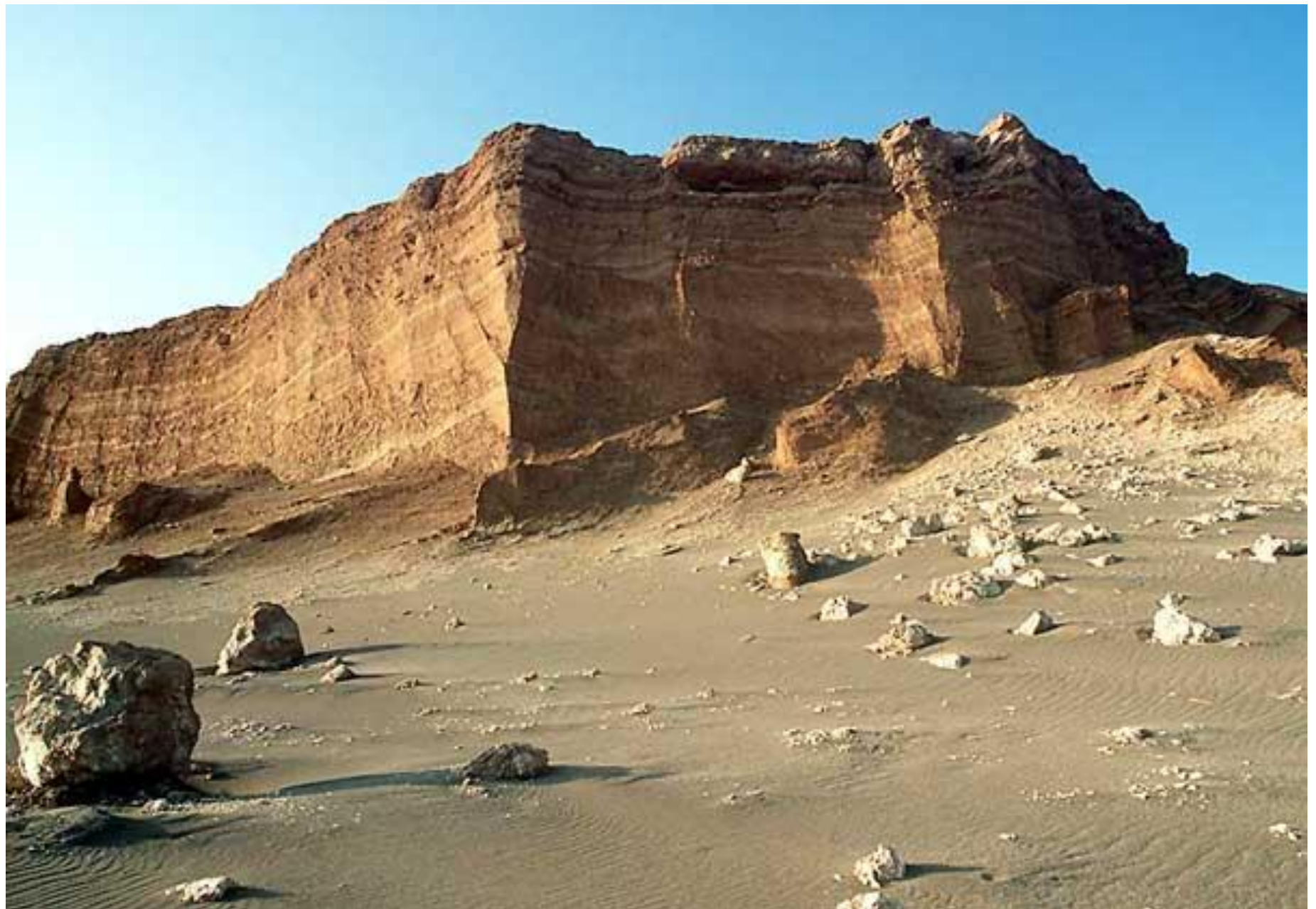
Пустыня Атакама, Чили