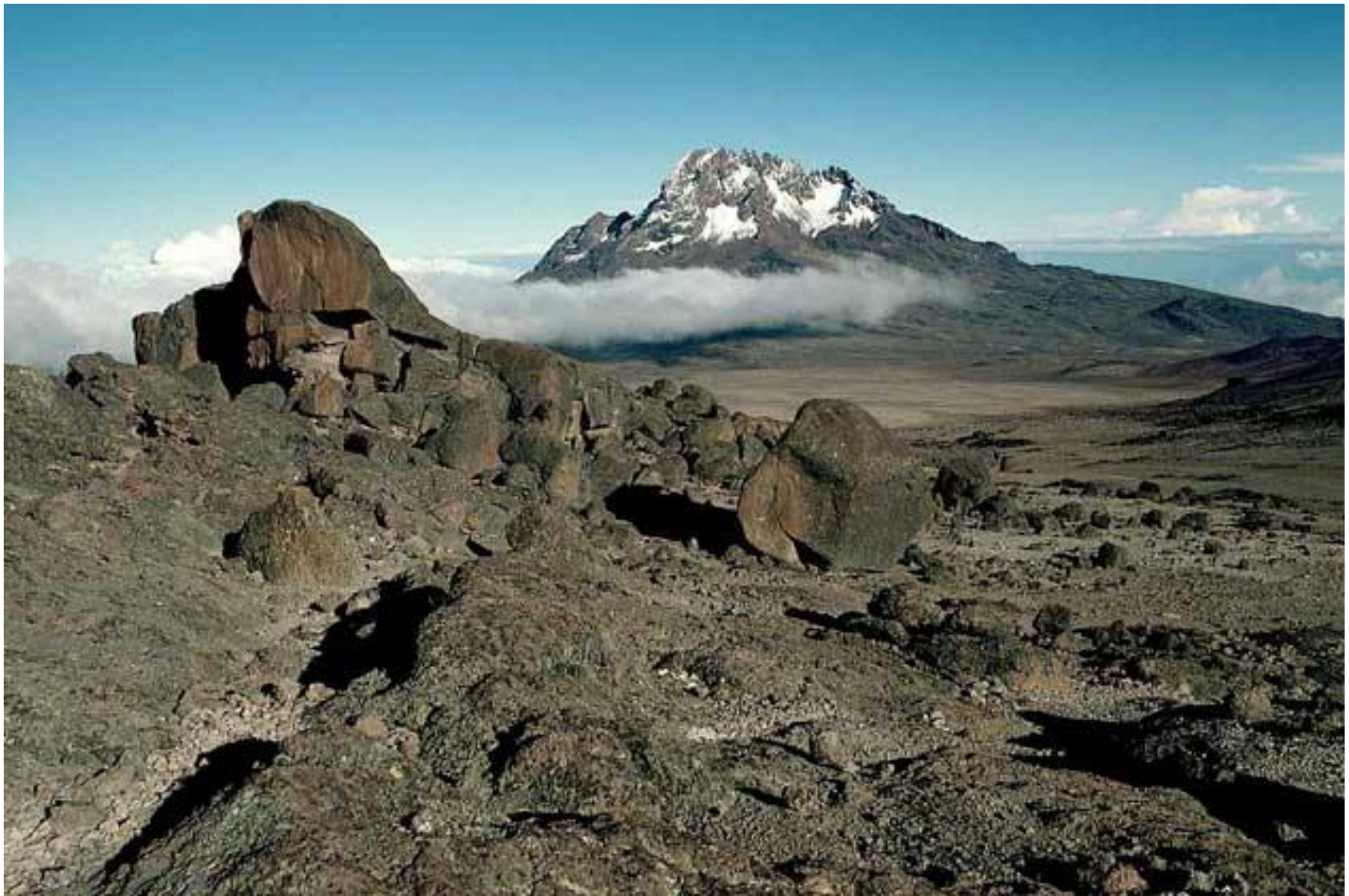
Массив Килиманджаро в Африке