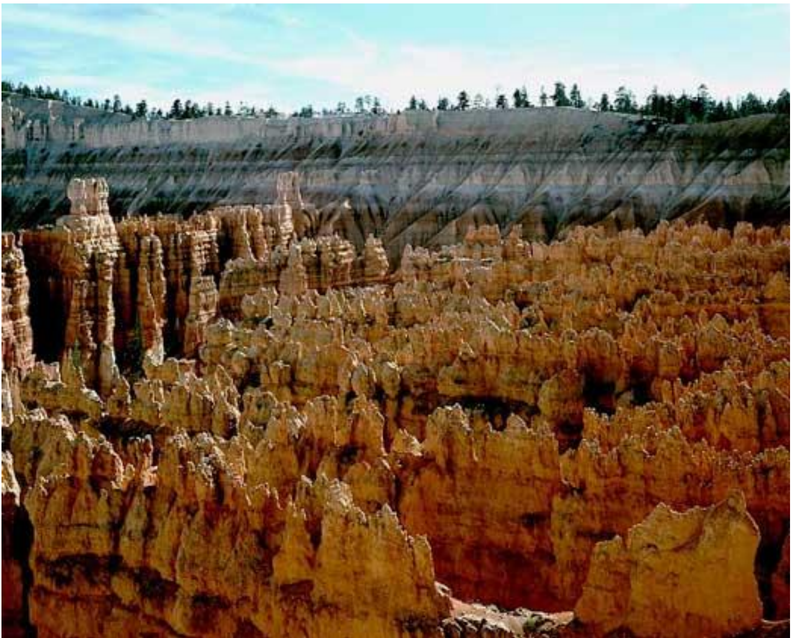
Морские слоистые осадки в нац. Парке Брайс-Каньон, штат Юта, США