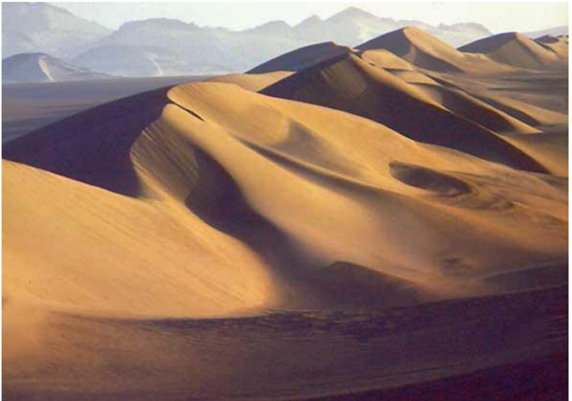
Песчаные дюны в Сахаре