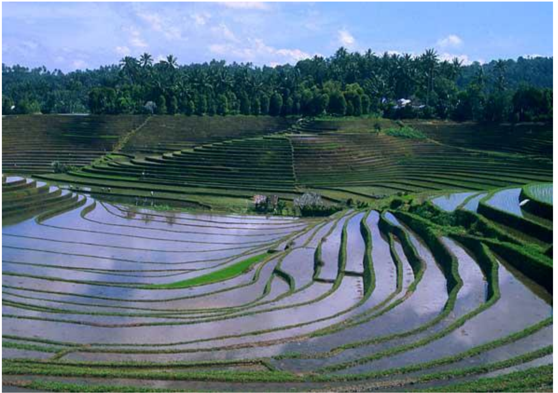
Террасированные рисовые реки на о. Бали, Индонезия