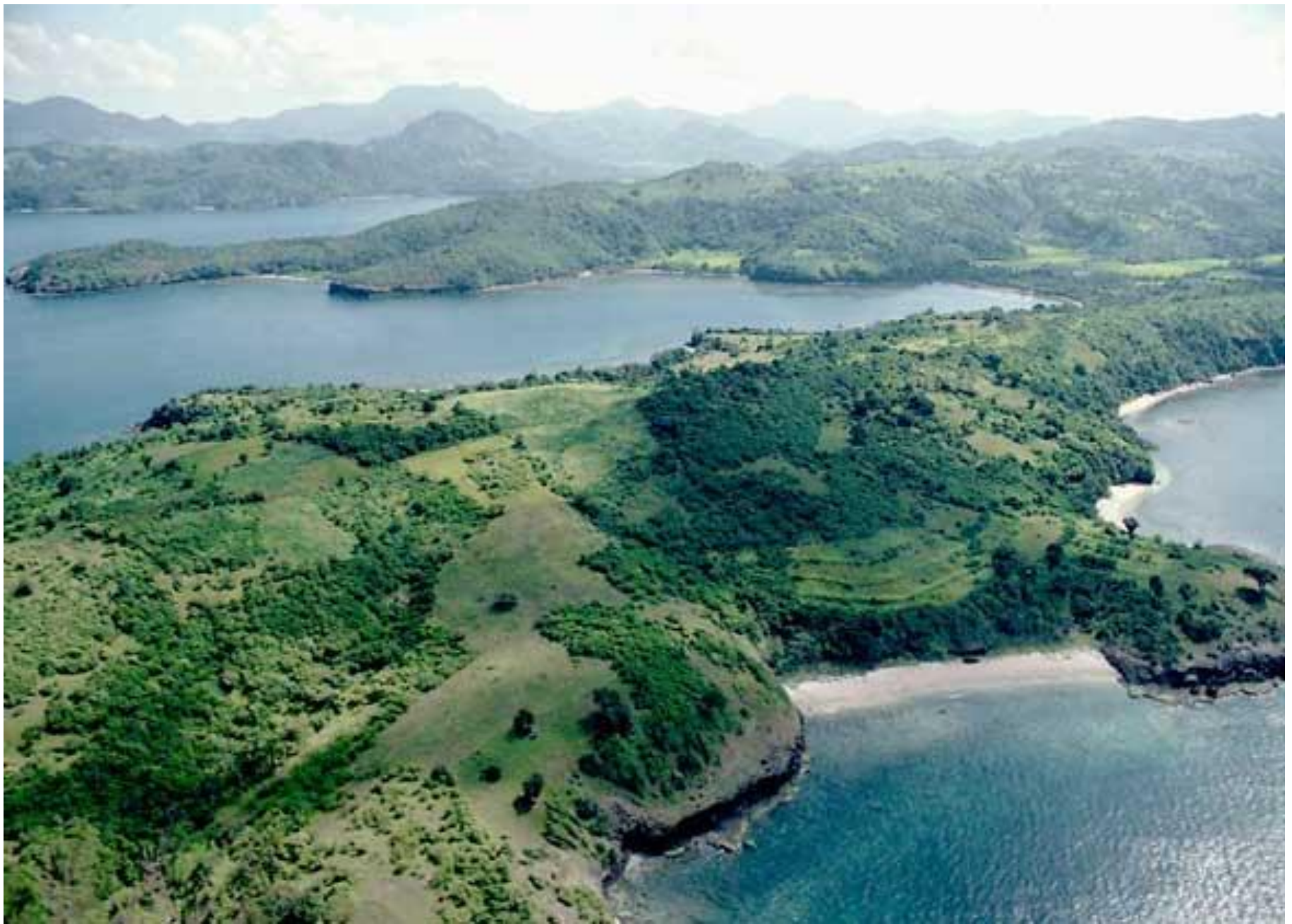
Архипелаг на острове Лусон