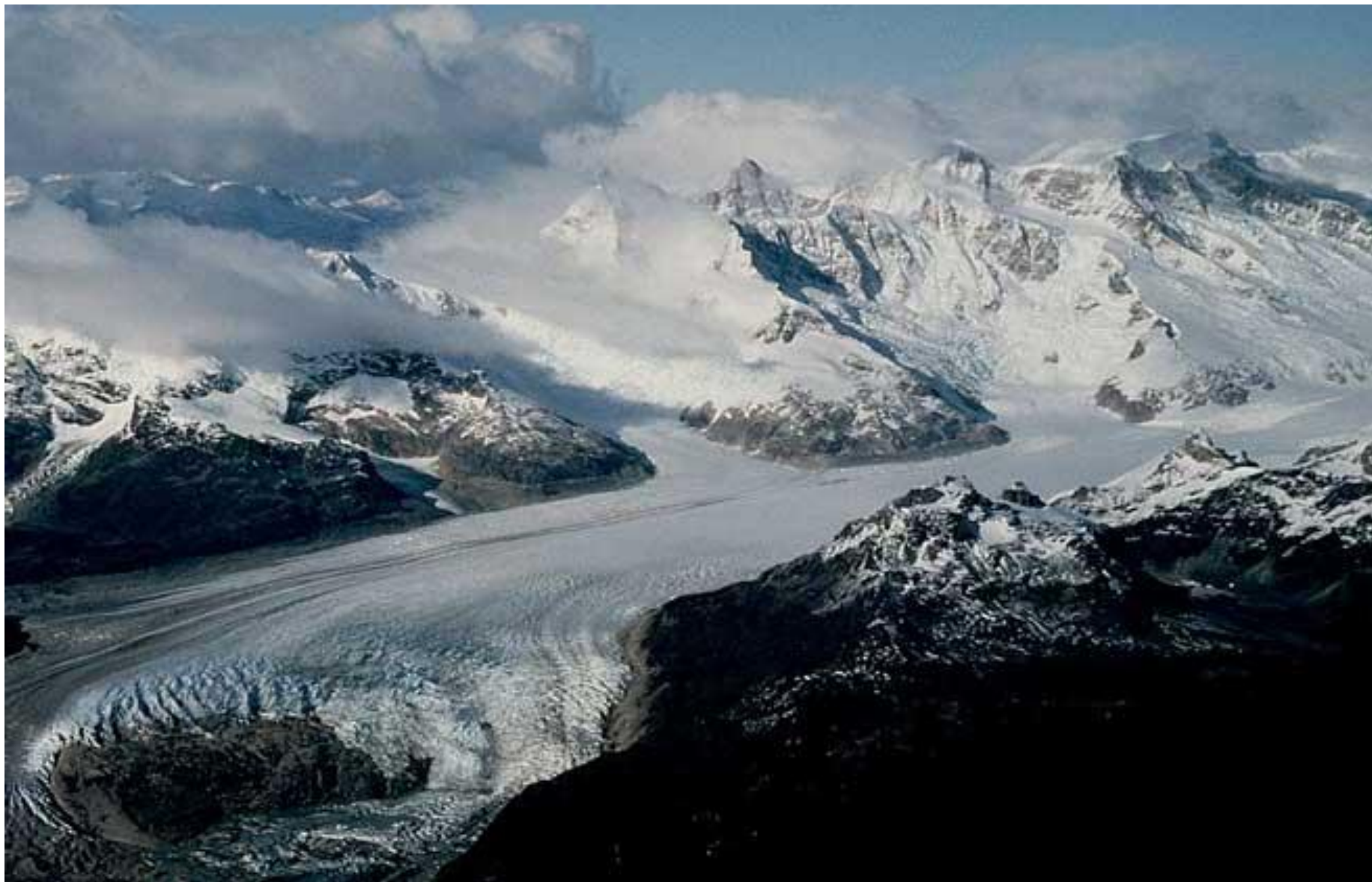
Крупный долинный ледник