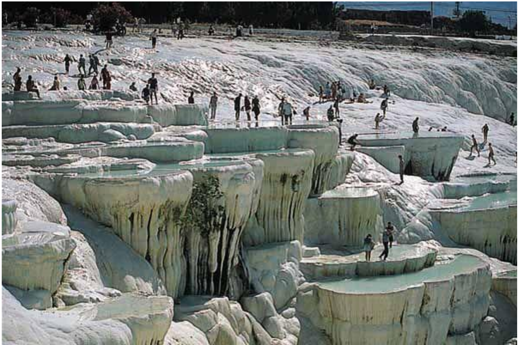
Солевые ванны в Памуккале, Турция