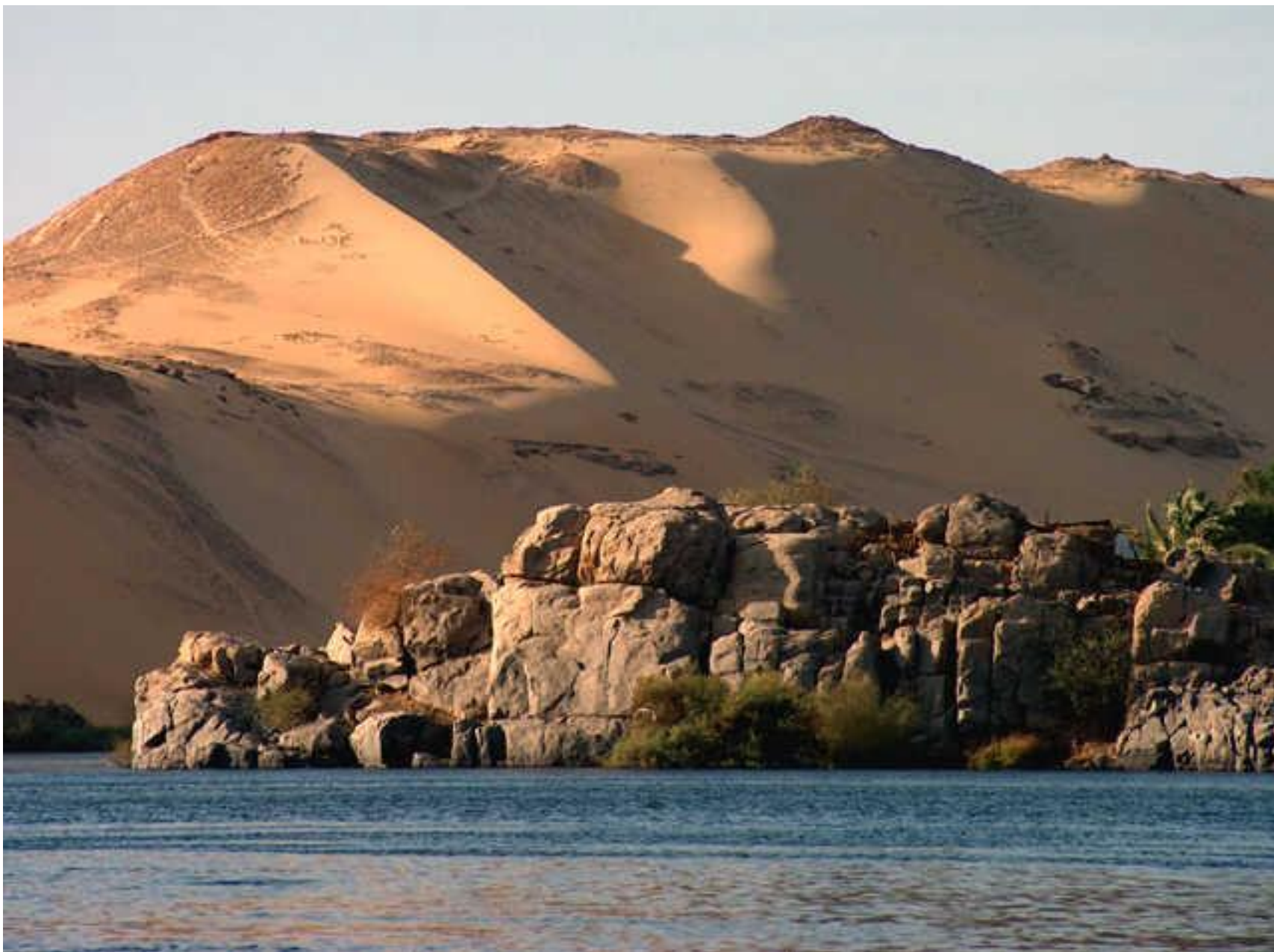
Берег реки Нил