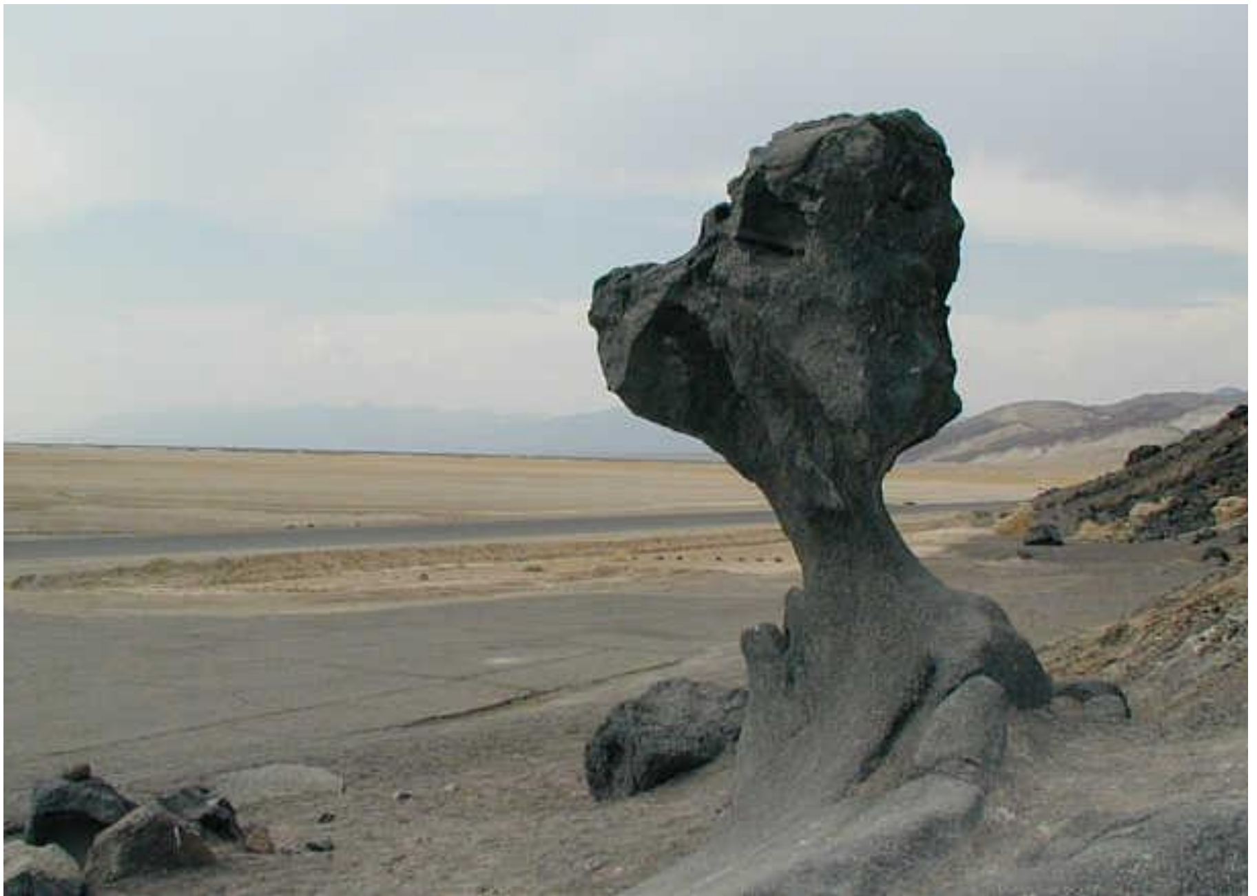
Долина смерти (Большой каньон), США