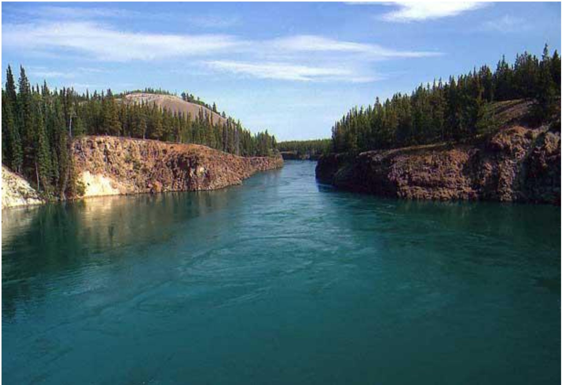
Река Юкон, Канада