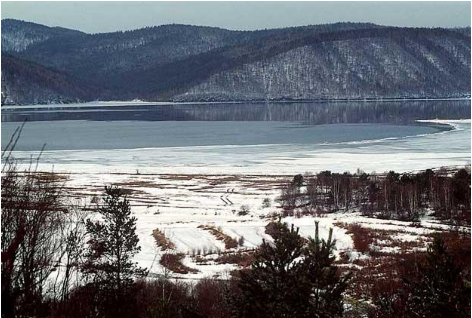
Озеро Байкал, Россия