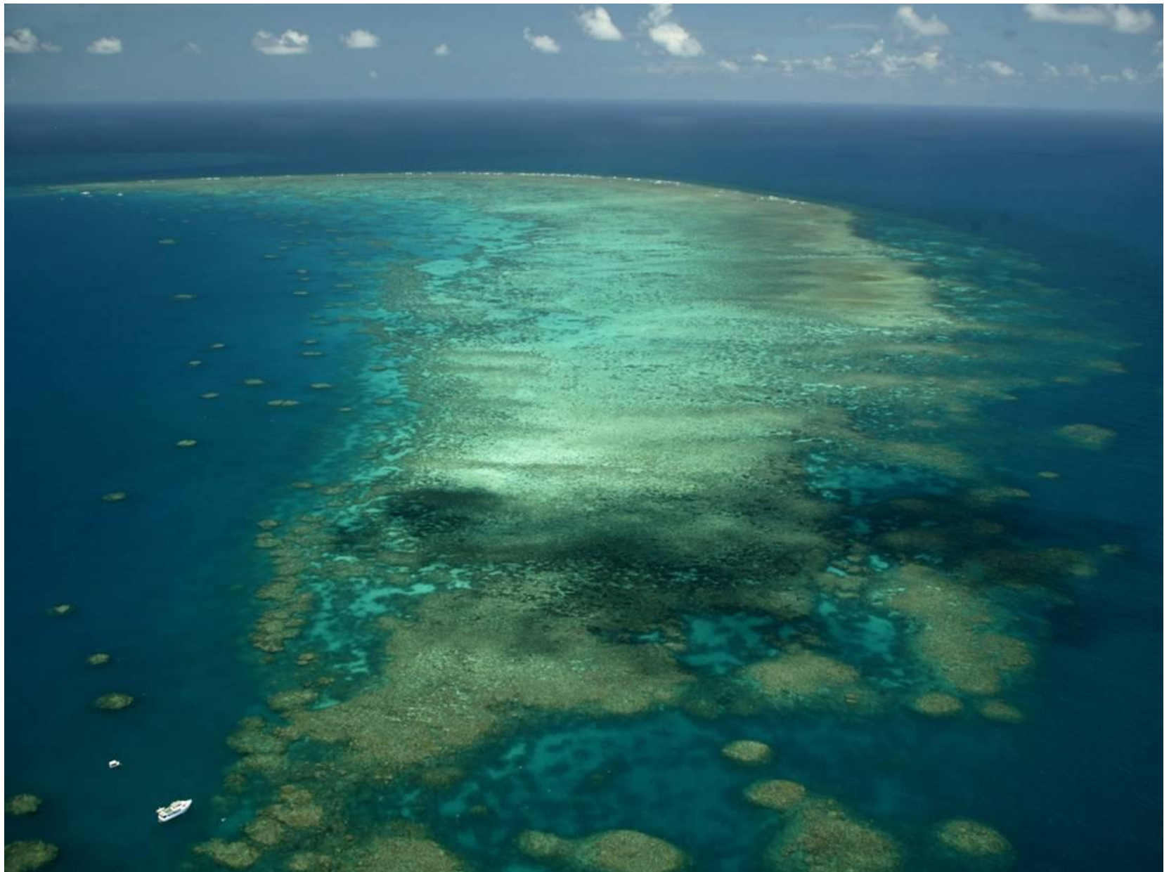
Большой барьерный риф, Австралия