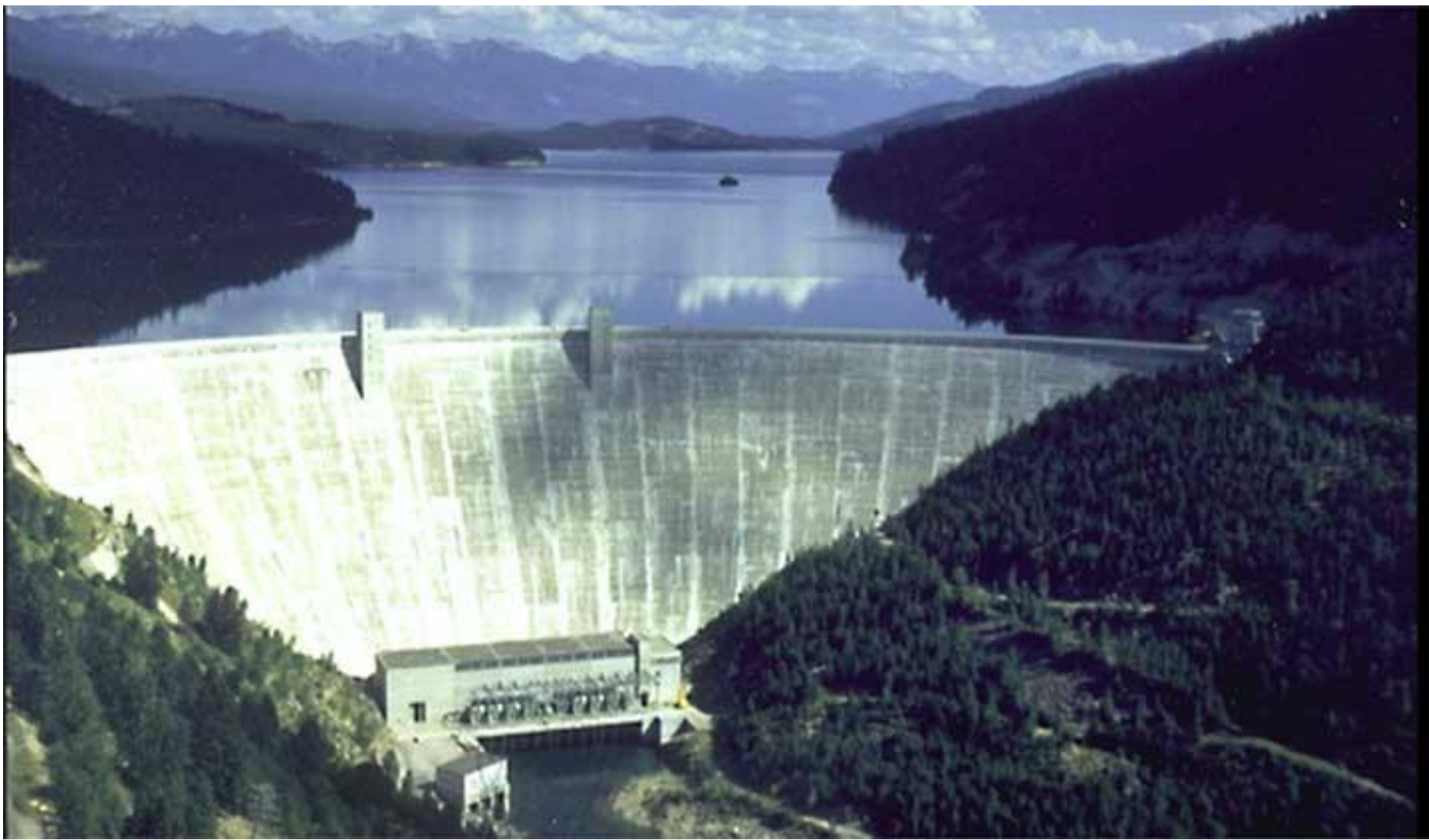
Арочная плотина Хангри-Хорс на речке Флатхед, США