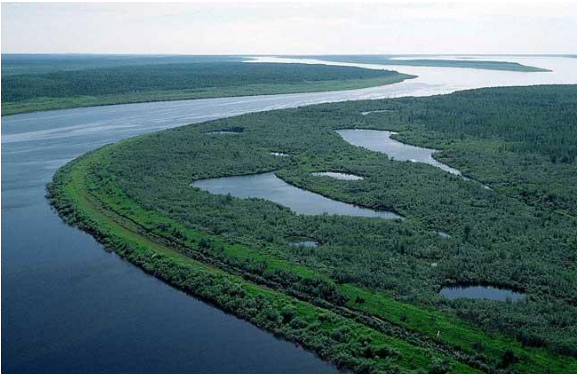
Река Енисей, Россия