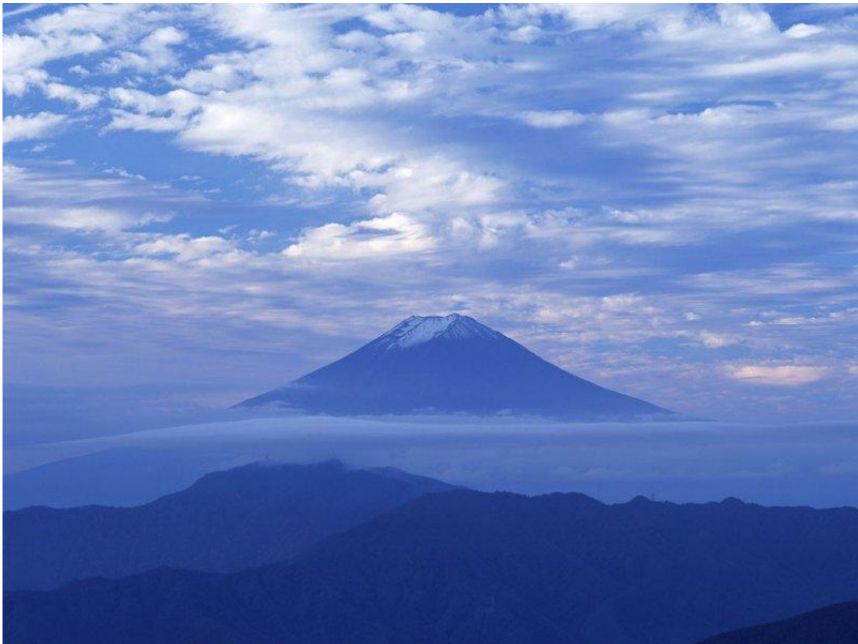
Величайшая гора Японии – Фудзияма