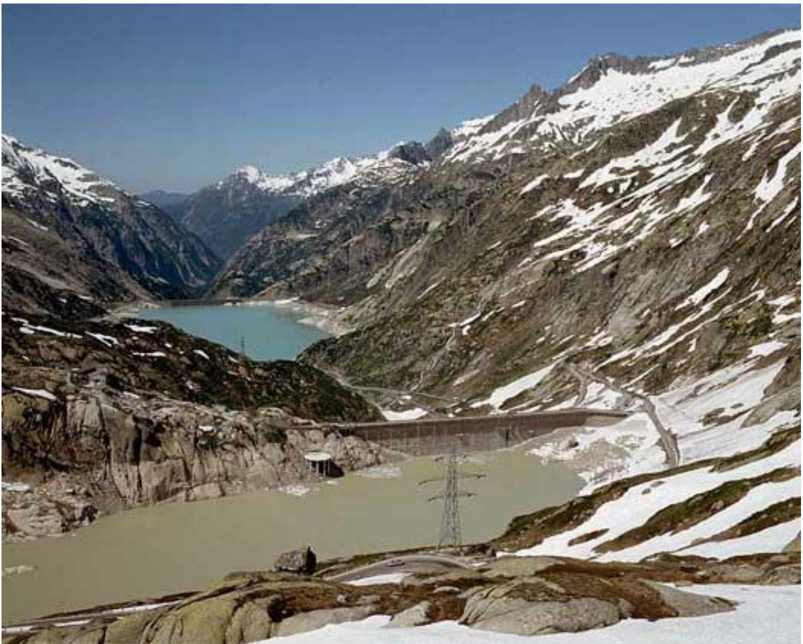
Водохранилища в Альпах, Швейцария