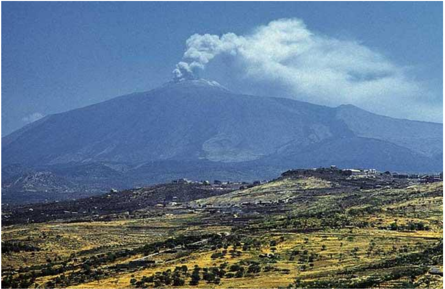
Извержение вулкана Этна, Сицилия