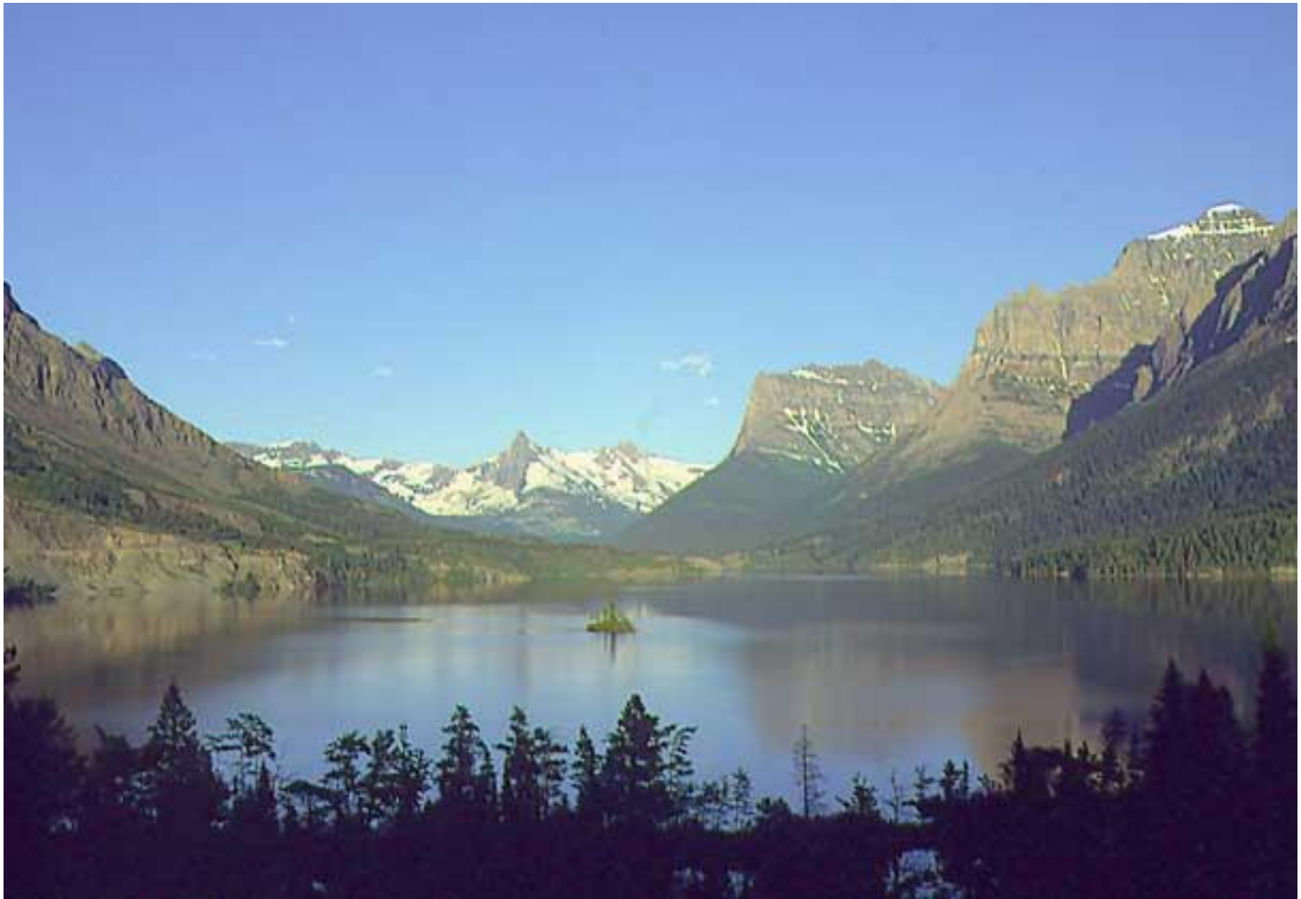
Озеро ледникового происхождения в нац. парке Глейшер, США