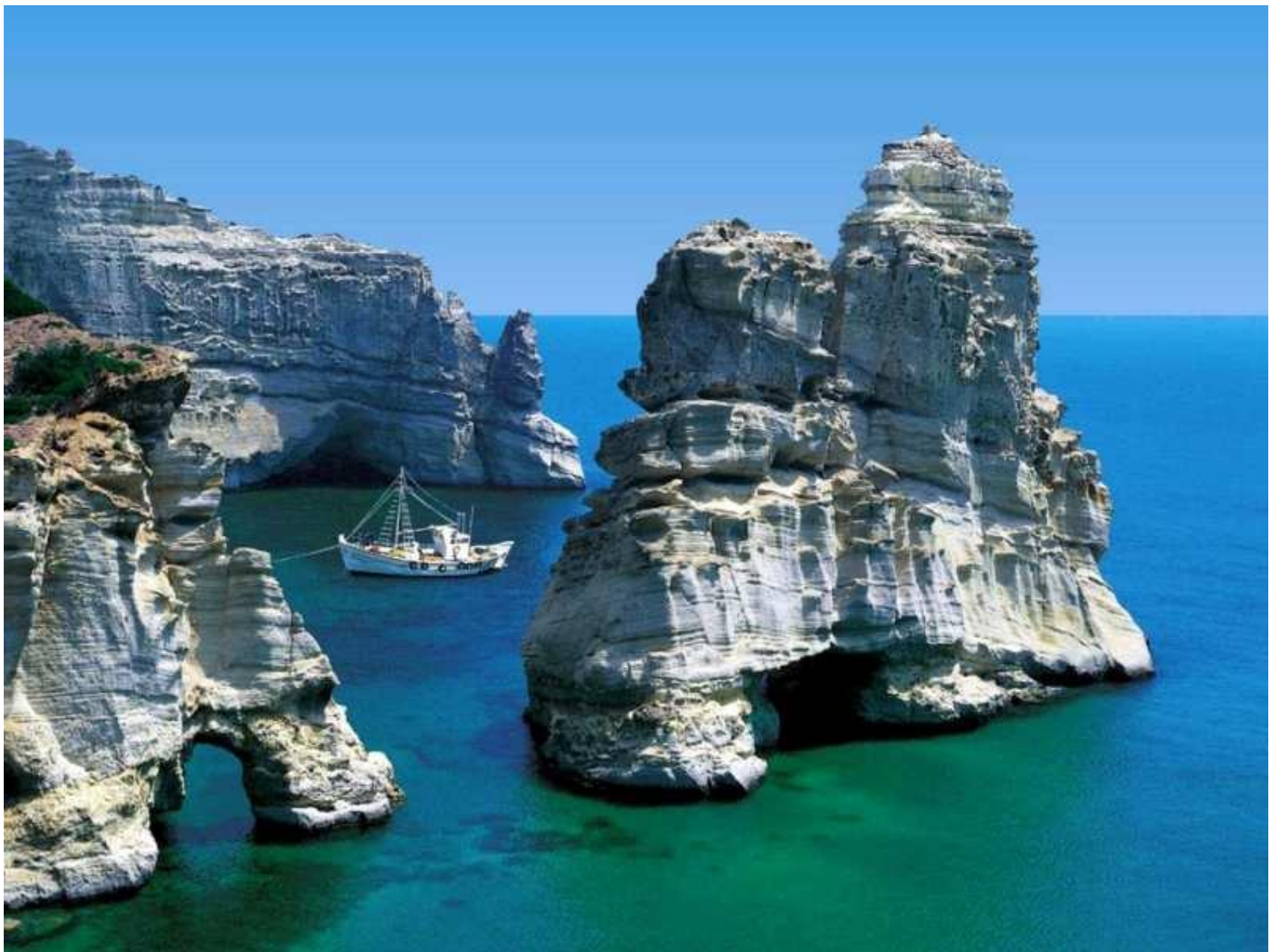
Скалы и утёсы на о. Милос в Греции