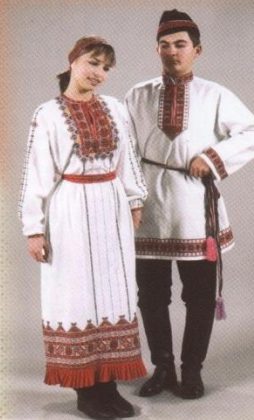
Стилизованный народный костюм Конец XX в.