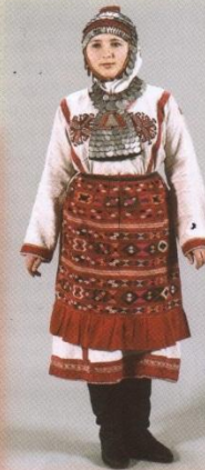
Конец XIX– начало XX в.