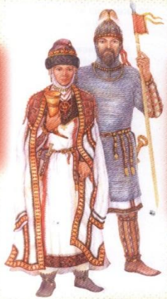
Предки чувашей – болгары – обитатели Северного Кавказа и Причерноморья III–VIII вв.