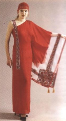
Произведения художников-модельеров Конец XX в.