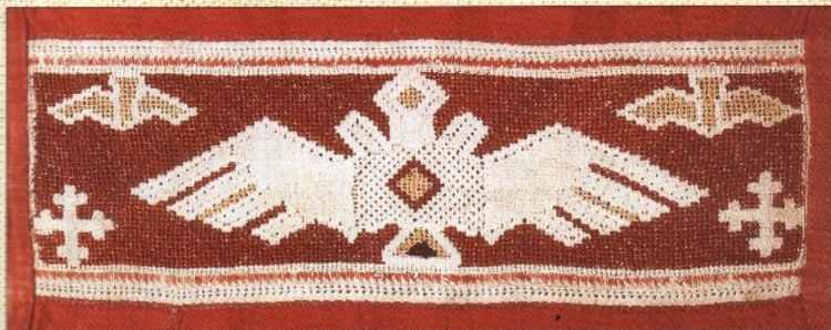
45-47. Изображение человека, животного, жизни в чувашском орнаменте. Узор

Вёсен кайака, ийваса тата э санлакан тёрри Pictures of being, animals life in a Chuvash ornament