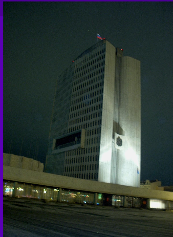
Здание Белого дома – администрации города Владивостока