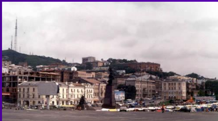
Улица Алеутская- старейшая улица города