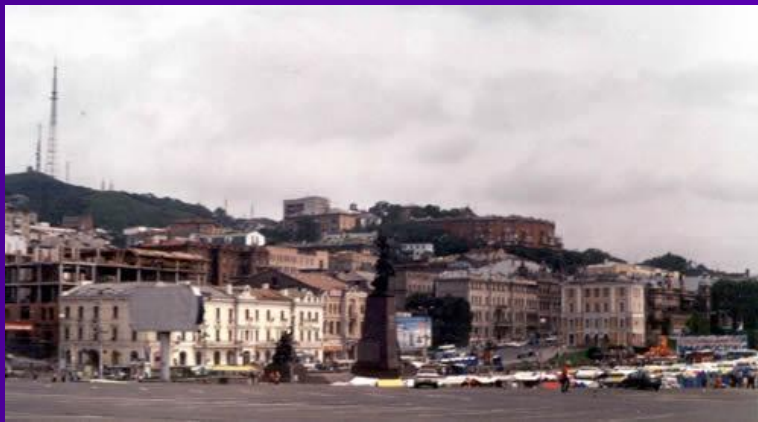
Улица Алеутская- старейшая улица города