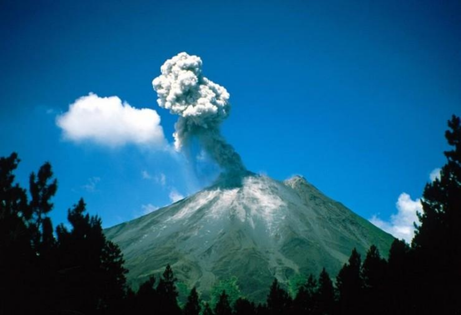
Самый высокий вулкан Камчатки – Ключевская Сопка 4750 метров