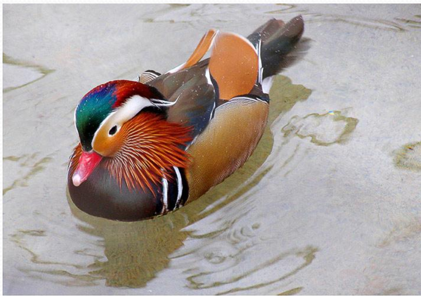
Утка - мандаринка