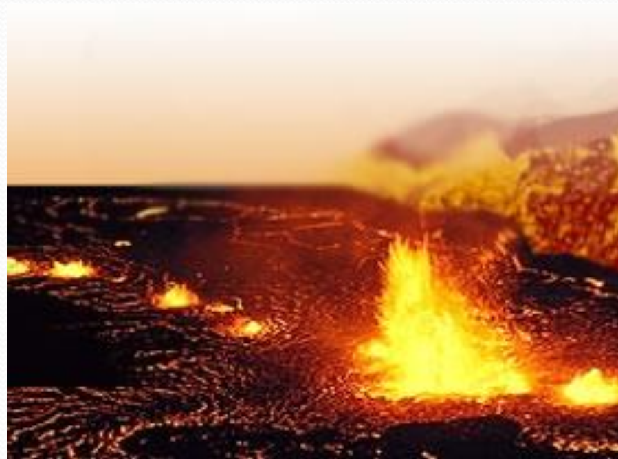
Огнедышащие горы - вулканы