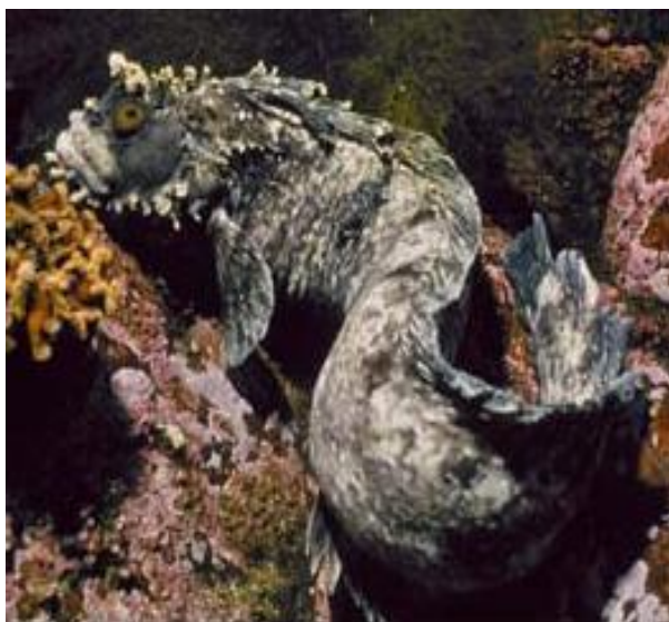
Японская мохоголовая собачка