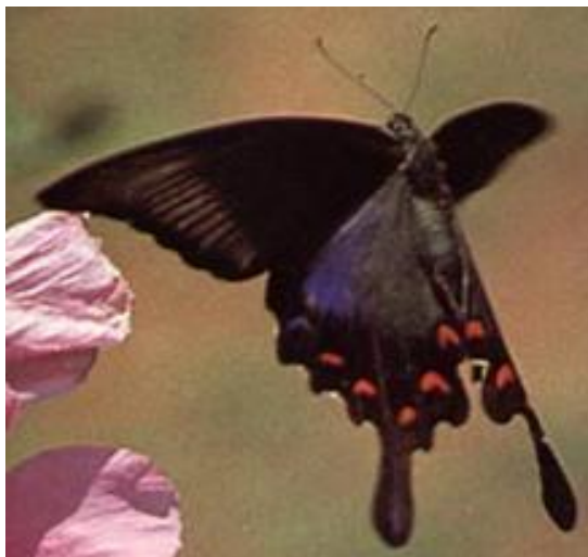
Самка махаона Маака