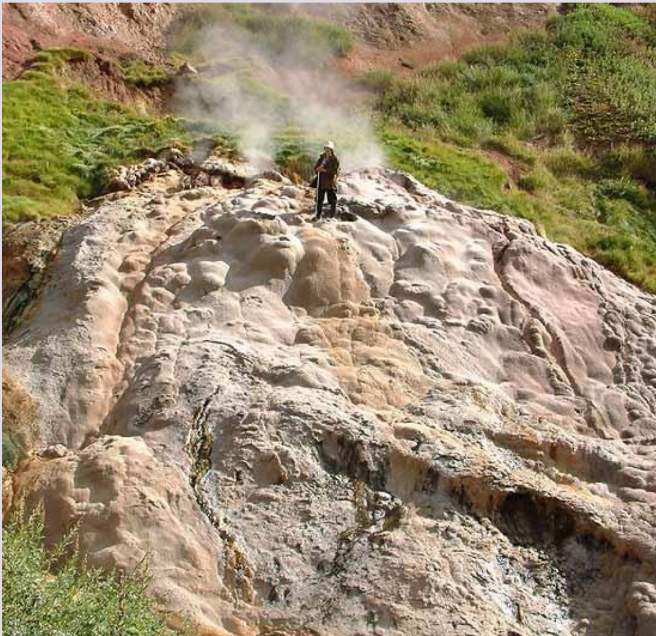
«Тройной» фонтанирует сразу из трех отверстий.