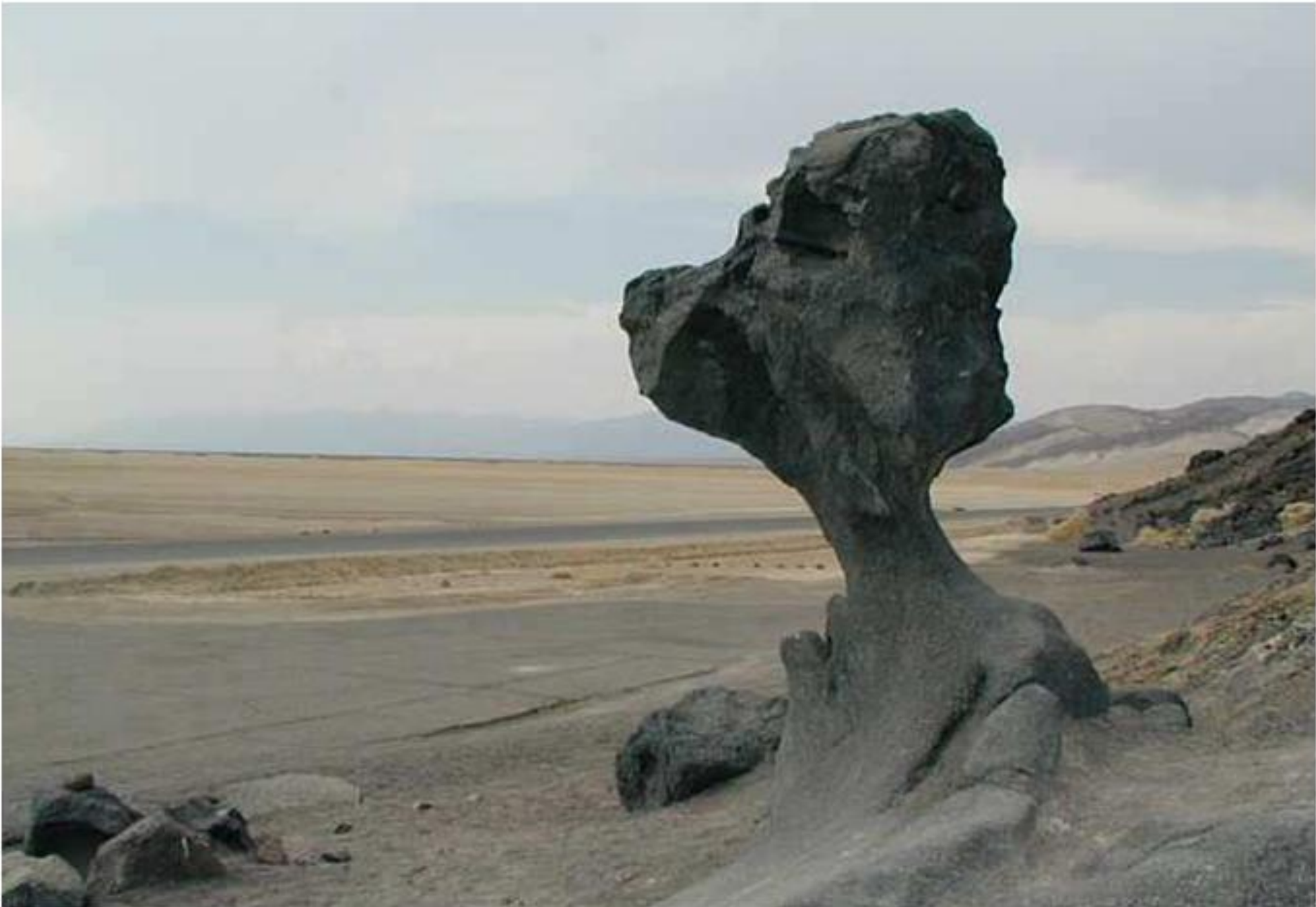
Долина смерти (Grand canyon), США