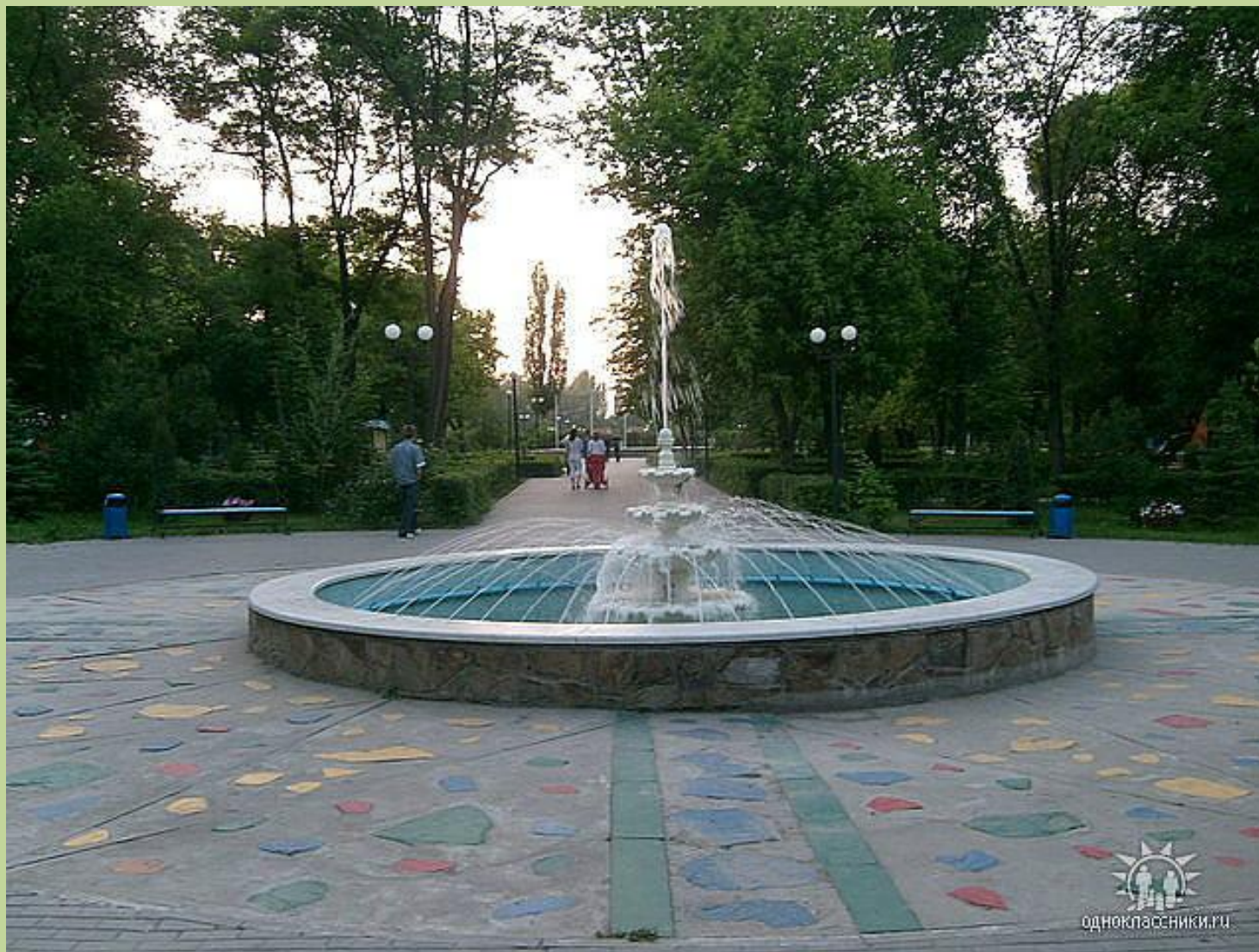
Фонтан а парке