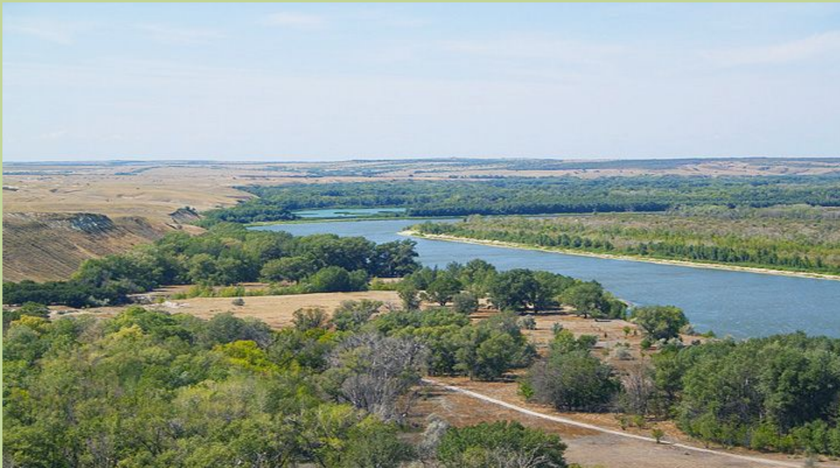
Река Северский Донец