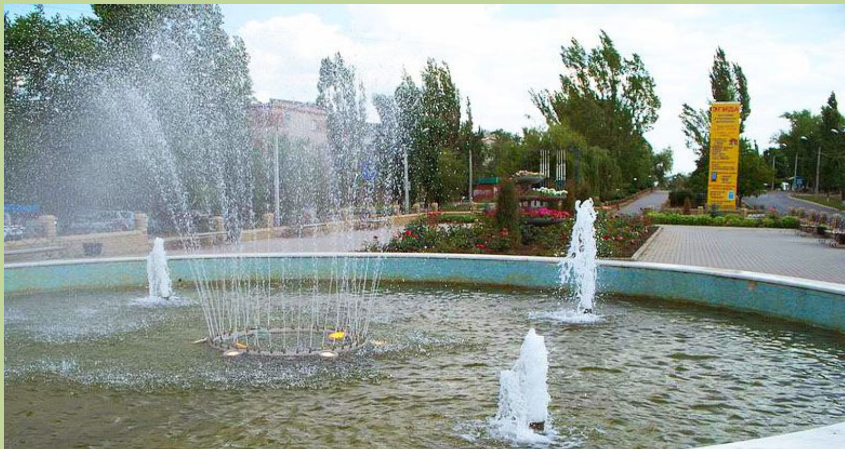
Фонтан по проспекту Ленина