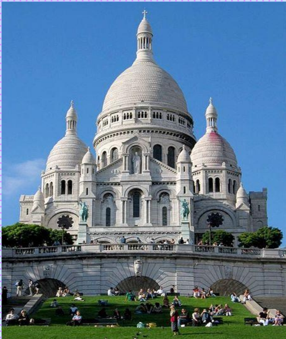
Церковь Сакре -Кер