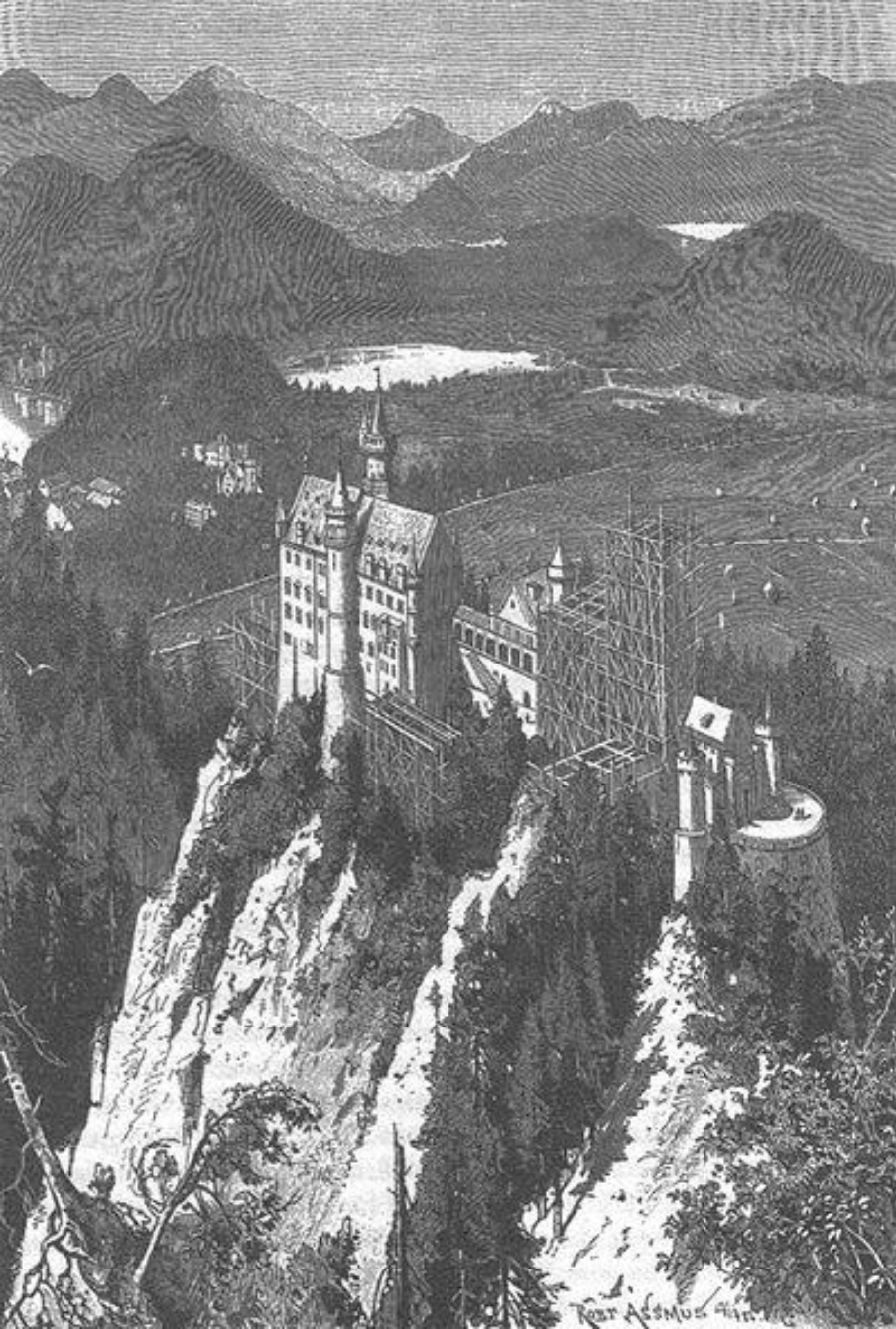
Замок в 1886 году

Замок Нойшванштайн стоит на месте двух крепостей, переднего и заднего Швангау. Король Людвиг II приказал на этом месте путём взрыва скалы опустить плато приблизительно на 8 м и создать тем самым место для постройки «сказочного дворца». После строительства дороги и прокладки трубопровода, 5 сентября 1869 года, был заложен первый камень для строительства огромного