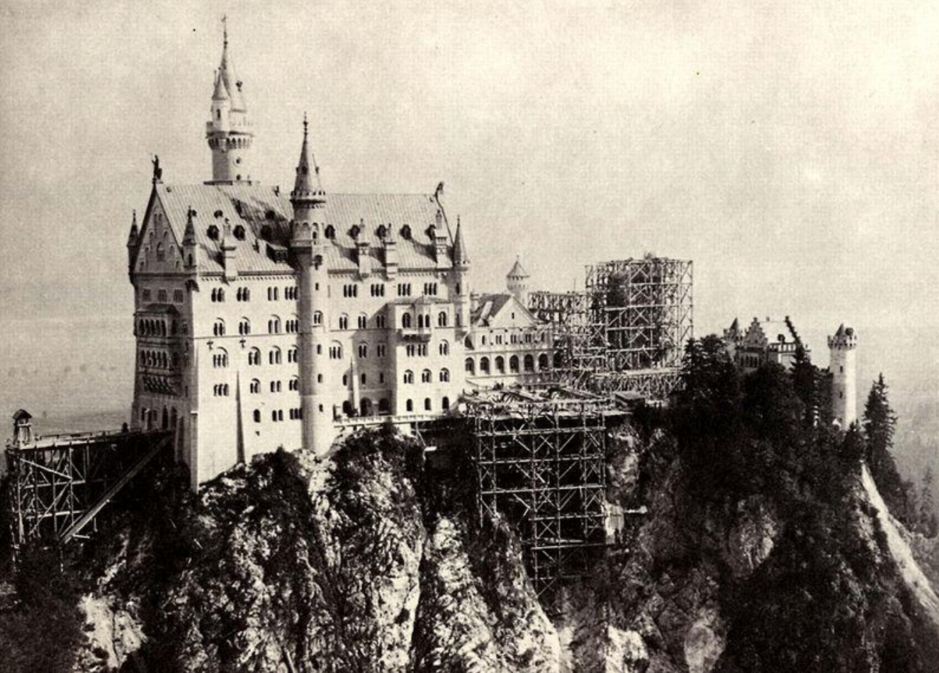
Строительные работы в замке (1882—1885)

В 1880 году на стройке было занято 209 плотников, каменотёсов и подсобных рабочих. После смерти короля все строительные работы были приостановлены. Третий этаж замка и рыцарское помещение не были достроены. Главная башня замка с церковью в готическом стиле, высотой 90 м, которая должна была возвышаться над всеми строениями не была построена вообще. Не была закончена и западная терраса, которая должна была вести к незаконченной