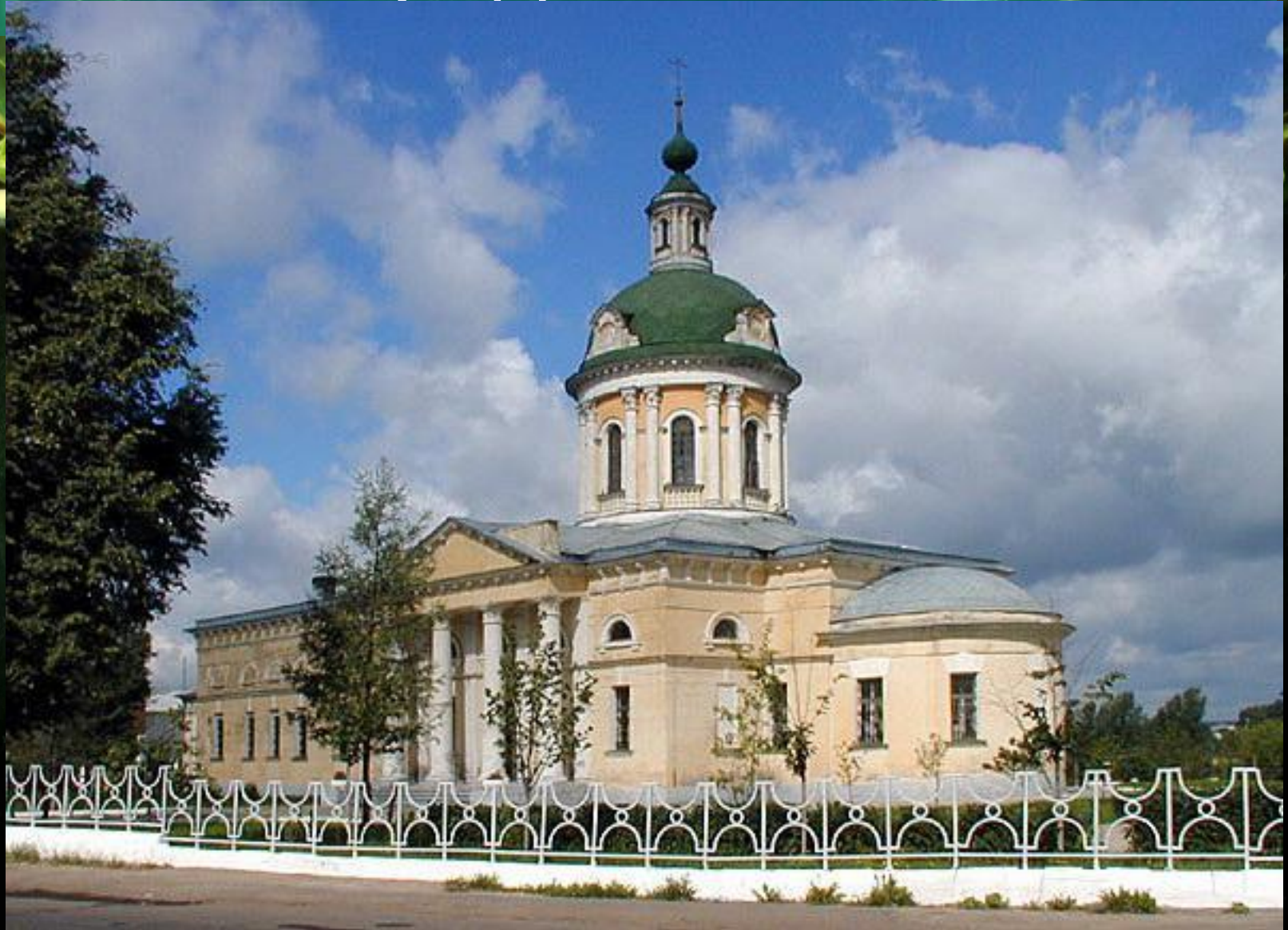
Церковь Михаила Архангела