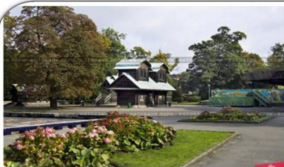
Калининградский зоопарк. Теремок

Один из самых больших и старых зоопарков России. Зоопарк был открыт в 1896 году.