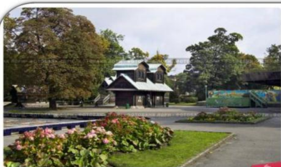
Калининградский зоопарк. Теремок

Один из самых больших и старых зоопарков России. Зоопарк был открыт в 1896 году.