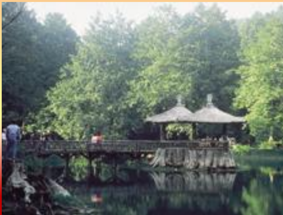
姊妹潭 - Пруд сестер