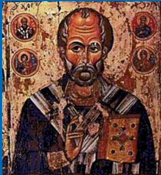
*Икона «Николай Чудотворец»