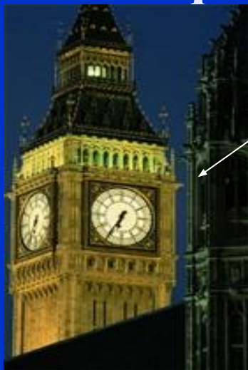
3. Биг Бен