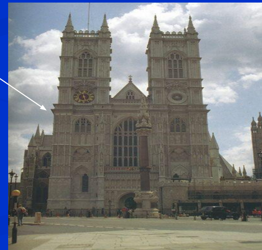
4. Вестминстерское аббатство