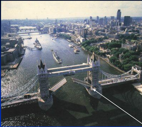
1. Тауэрский мост