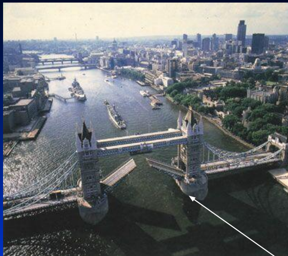
1. Тауэрский мост