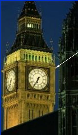
3. Биг Бен