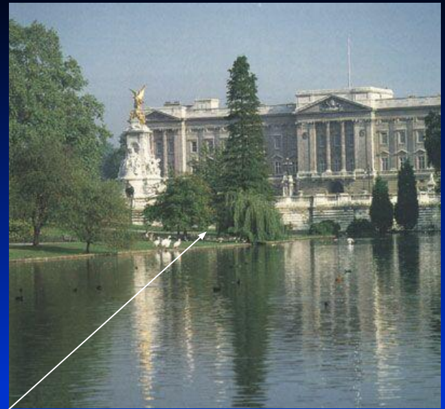
2. Букингемский дворец