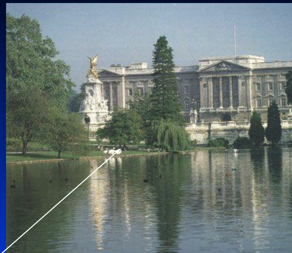
2. Букингемский дворец