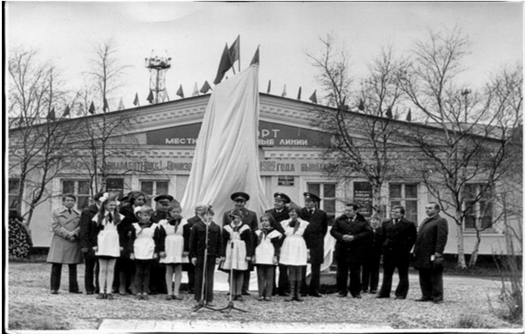
Торжественное открытие памятной стелы воинам-авиаторам 7 октября 1982г.