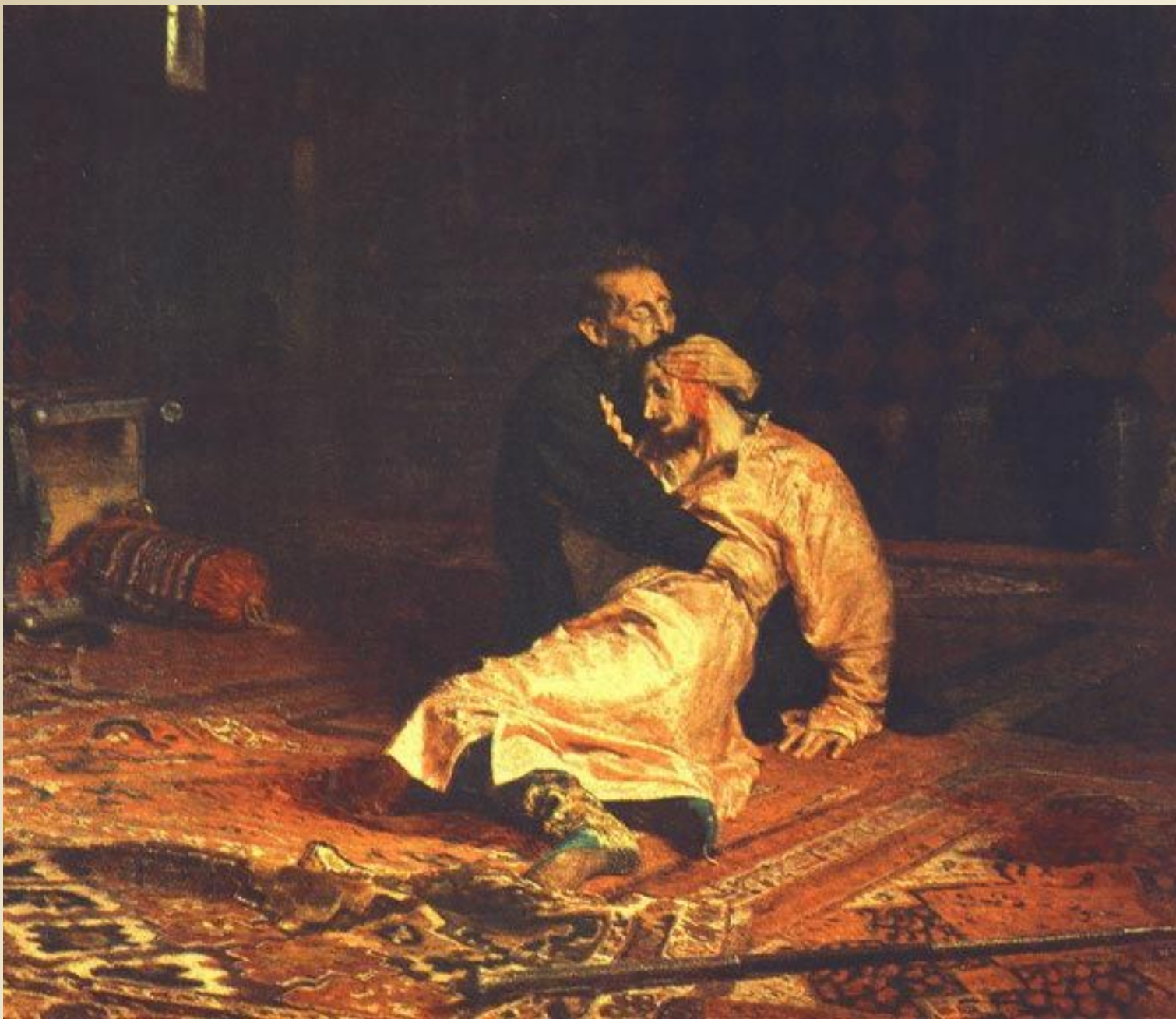
И. Репин. Иван Грозный убивает своего