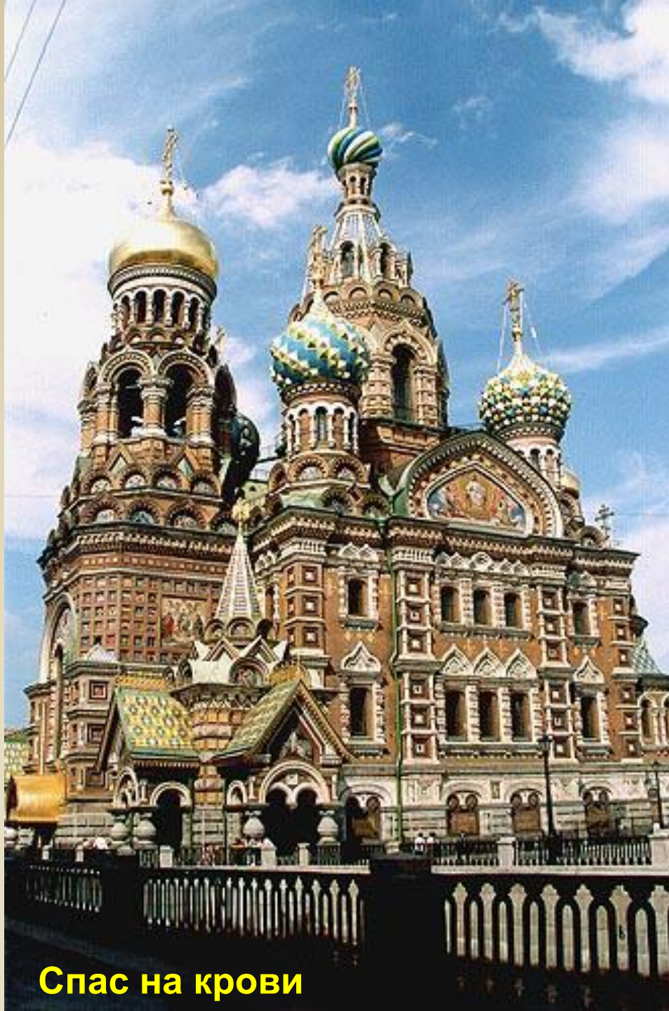
Спас на крови