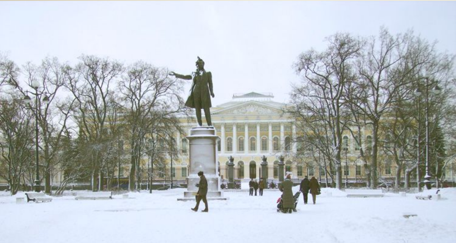
Памятник А. С. Пушкину на площади Искусств. Автор М.К. Аникушин