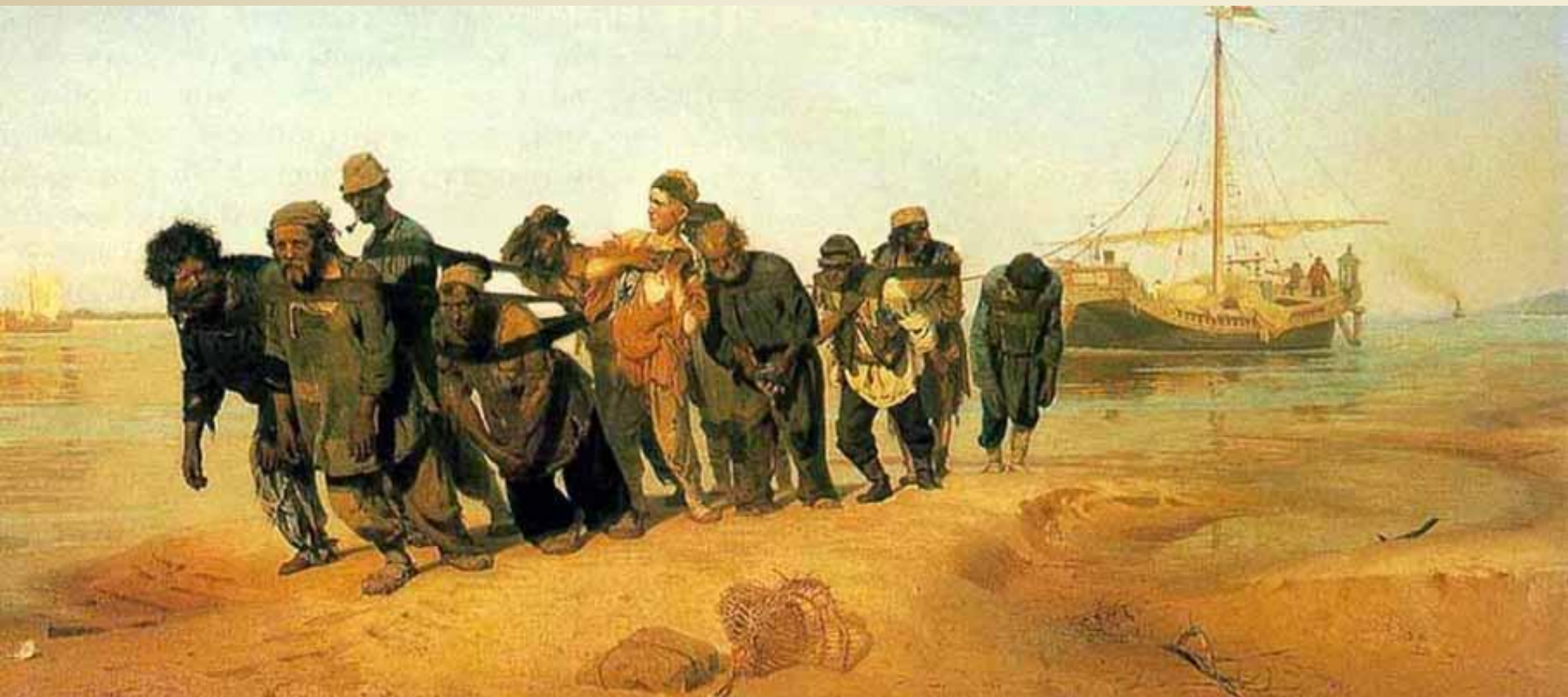
И.Репин. Бурлаки на Волге.