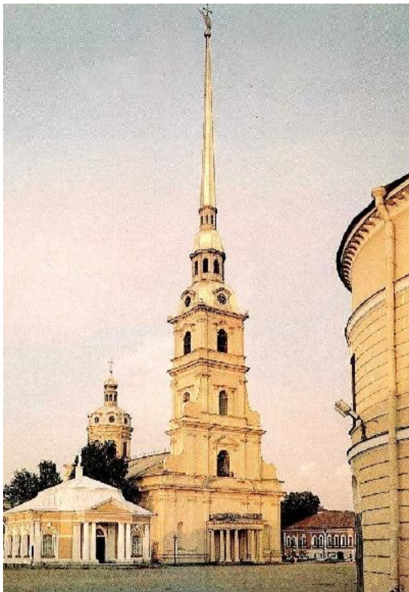
Ботный дом и колокольня Петропавловского собора