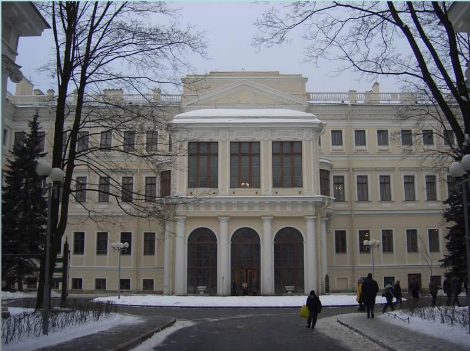
Невский пр., 39 (Аничков дворец)