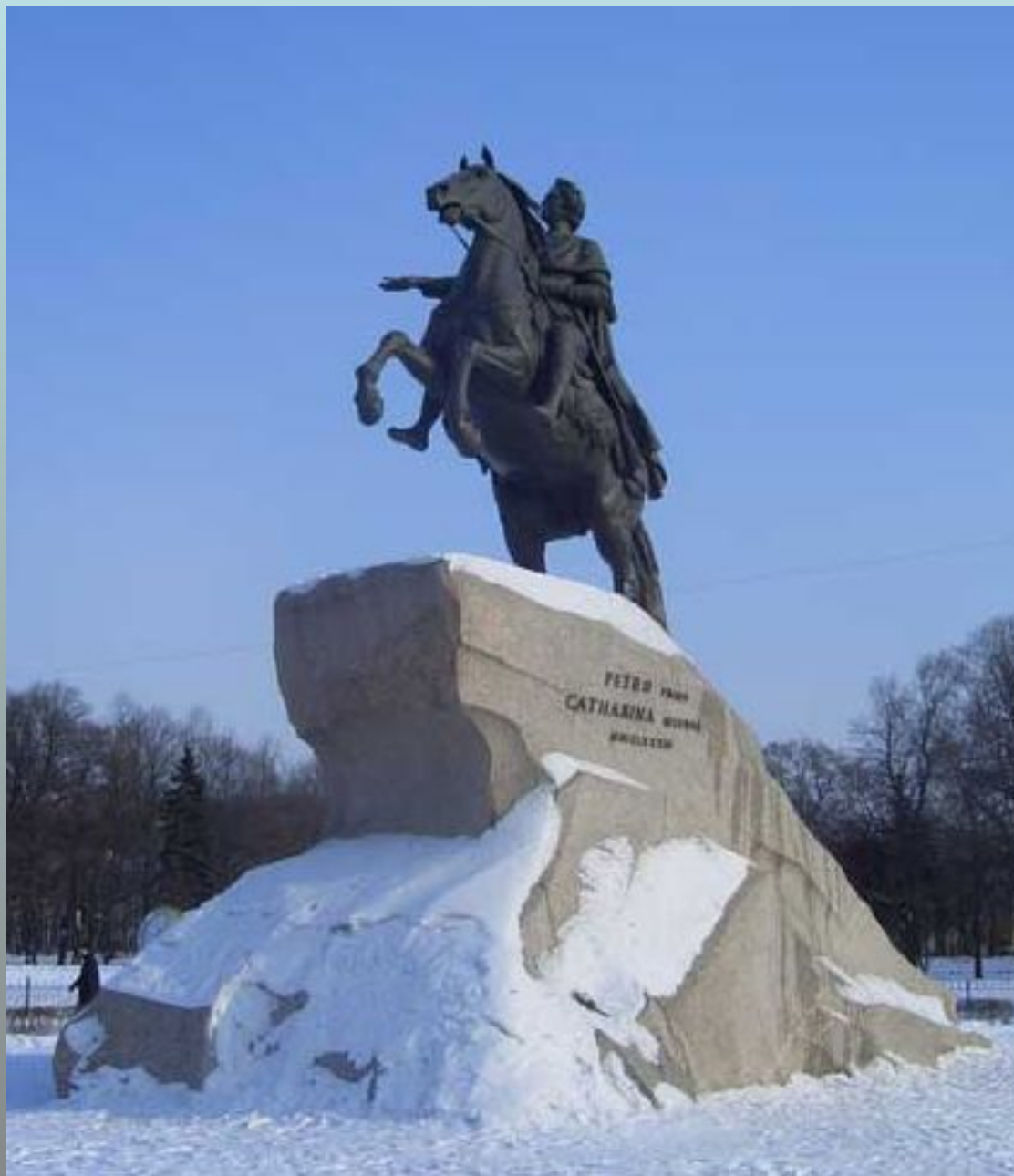
Медный всадник (памятник Петру I)

Место расположения памятника Петру I выбрано не случайно. Рядом находятся основанное императором Адмиралтейство, здание главного законодательного органа царской России - Сената. Екатерина II настаивала на размещении памятника в центре Сенатской площади. Автор скульптуры, Этьен-Морис Фальконе, поступил по своему, установив "Медный всадник" ближе к Неве.