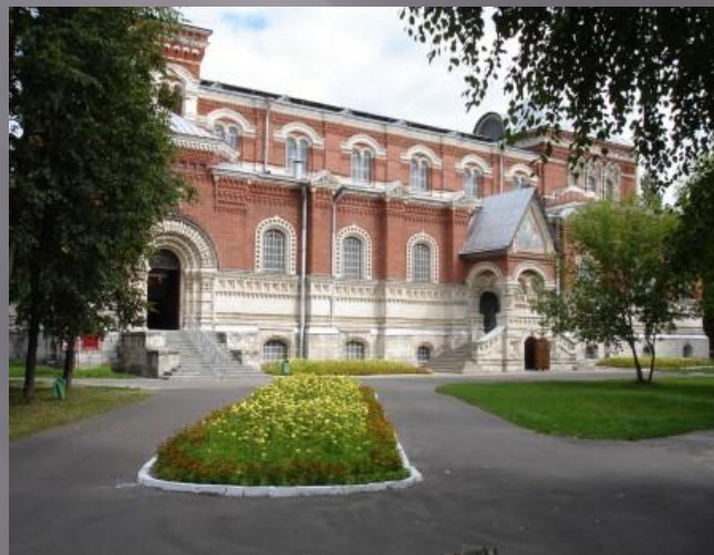
Посещение Музея Хрусталя