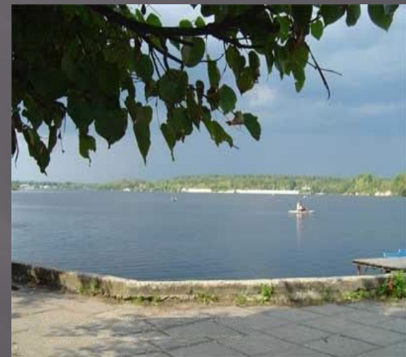
Отдых на Гусевском озере