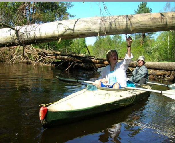
Спуск по реке Гусь

В Гусь-Хрустальном развиты многие виды туризма. Рекреационный, спортивный, экскурсионный – здесь вы найдете отдых для себя.