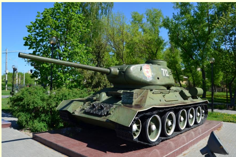
Выставка боевой техники у музея-диорамы