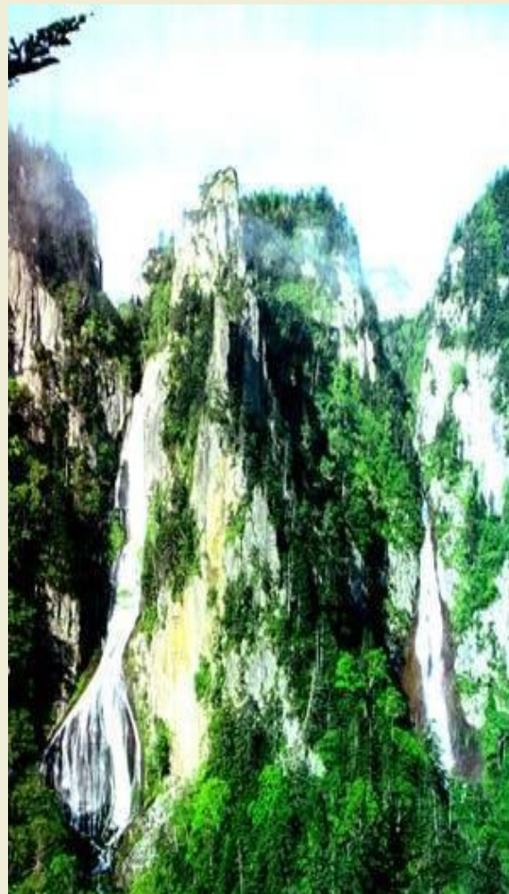
Водопад Гинга Рюзей