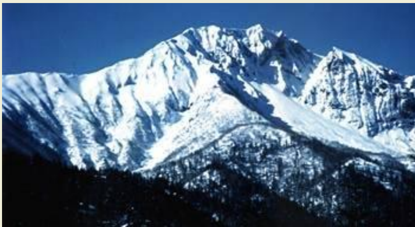
Восточный склон горы Нипесотсу