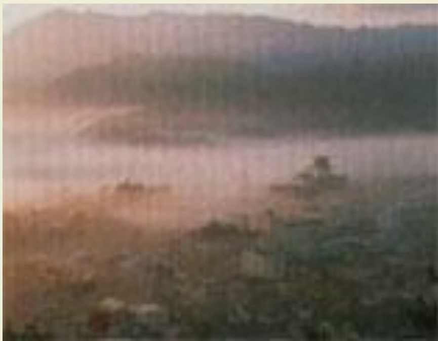
Курорт с горячими источниками Цикуока