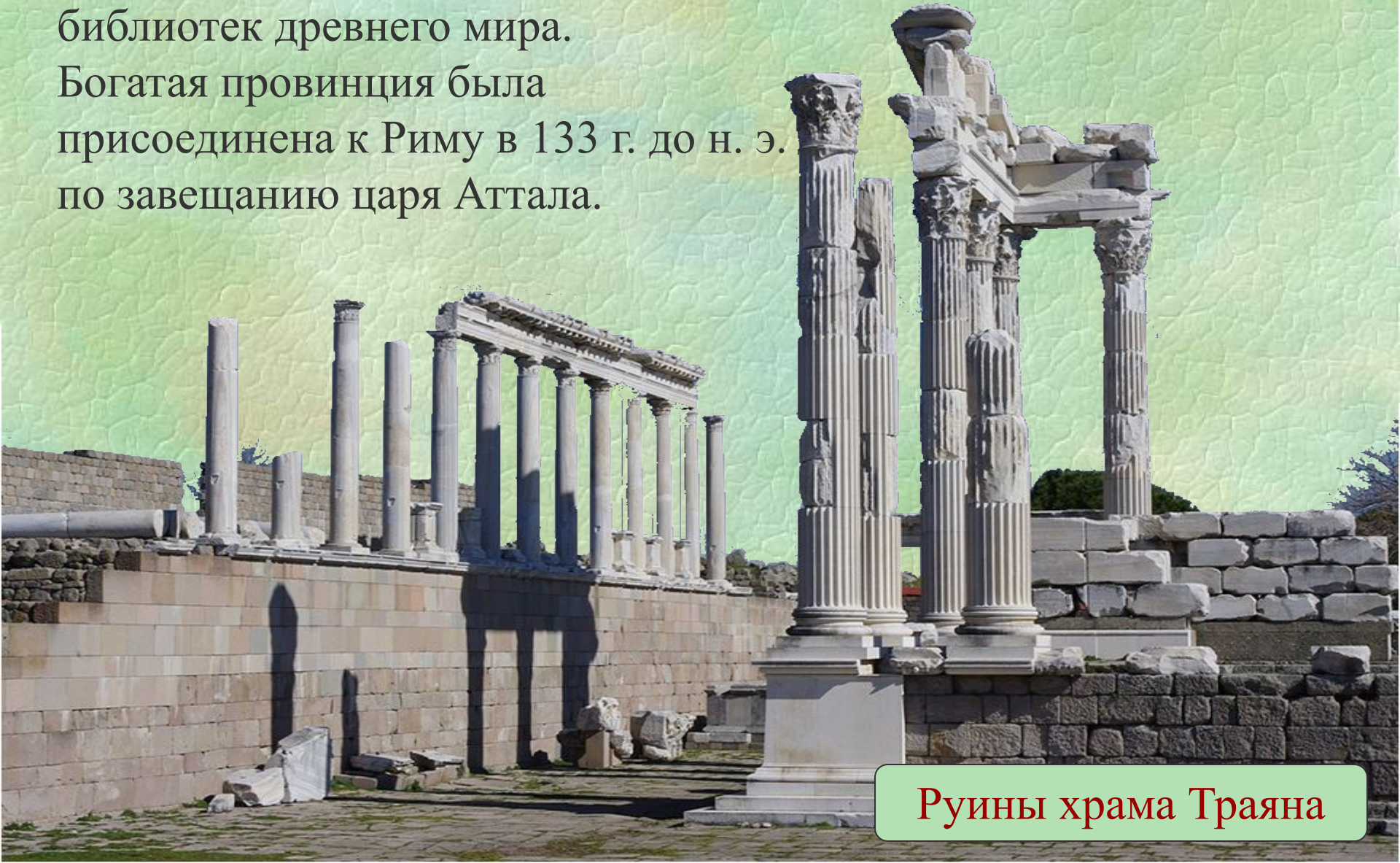
Руины храма Траяна

Богатая провинция была присоединена к Риму в 133 г. до н. э. по завещанию царя Аттала.