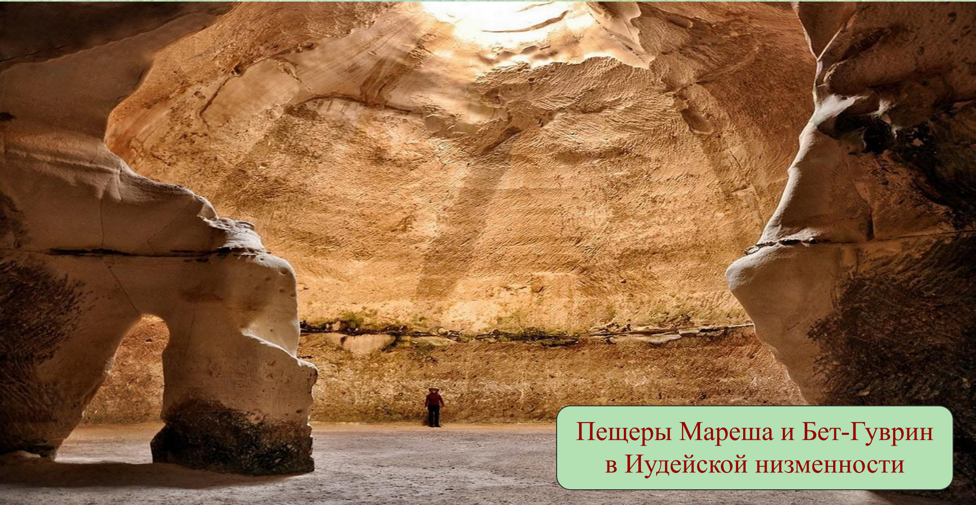
Пещеры Мареша и Бет-Гуврин в Иудейской низменности

Это «город в городе» — система пещер выдолбленных народом двух городов-побратимов Бет Гуврин Мареша и Нижней Иудеи. Сеть была создана более 2000 лет от железного века в эпоху крестовых походов.