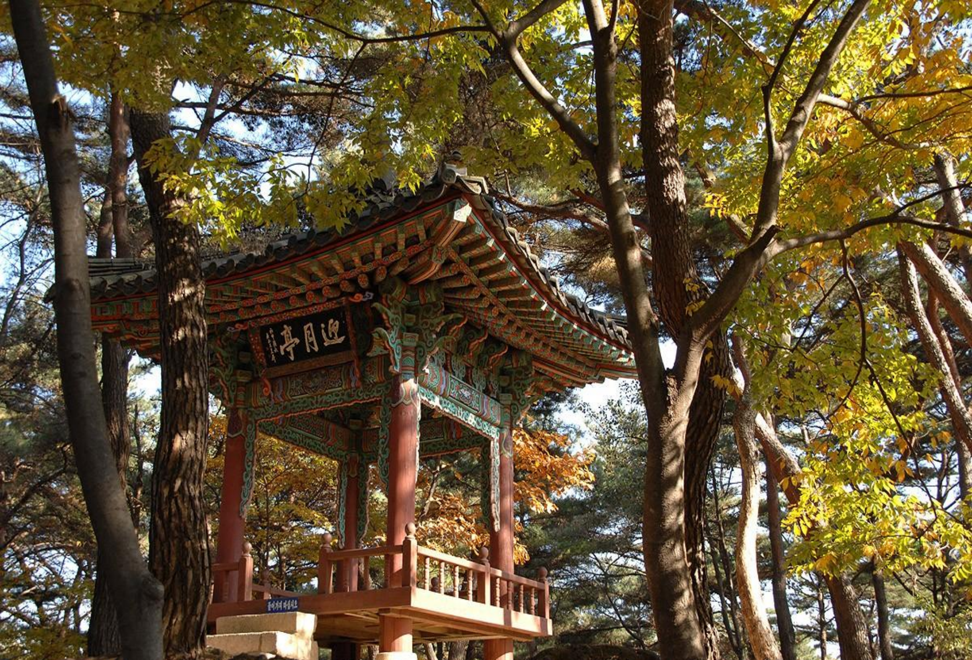
Южная Корея. Намхансан. Парк Намхансансон.