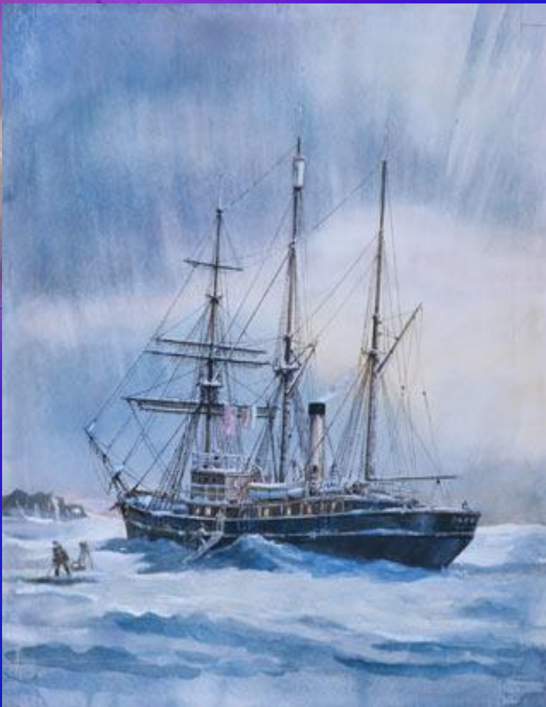
«Святой Фока» Судно экспедиции Г. Я. Седова