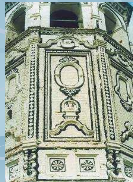
Колокольня церкви Николы Гостинного