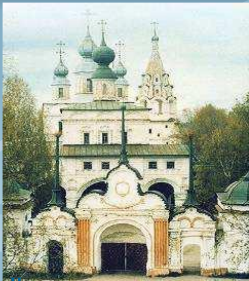
Центральные ворота Михайло-Архангельского монастыря