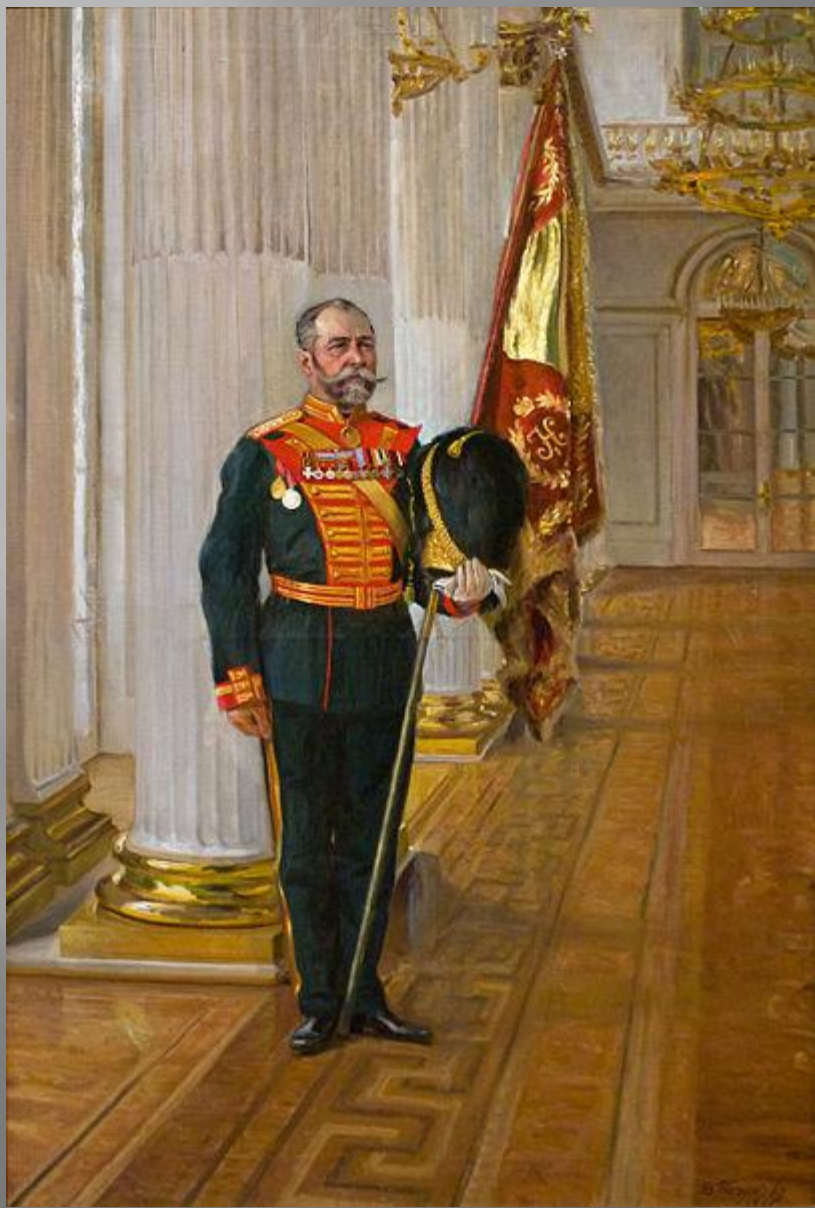
Фрагмент оформления (картина 1915 года)