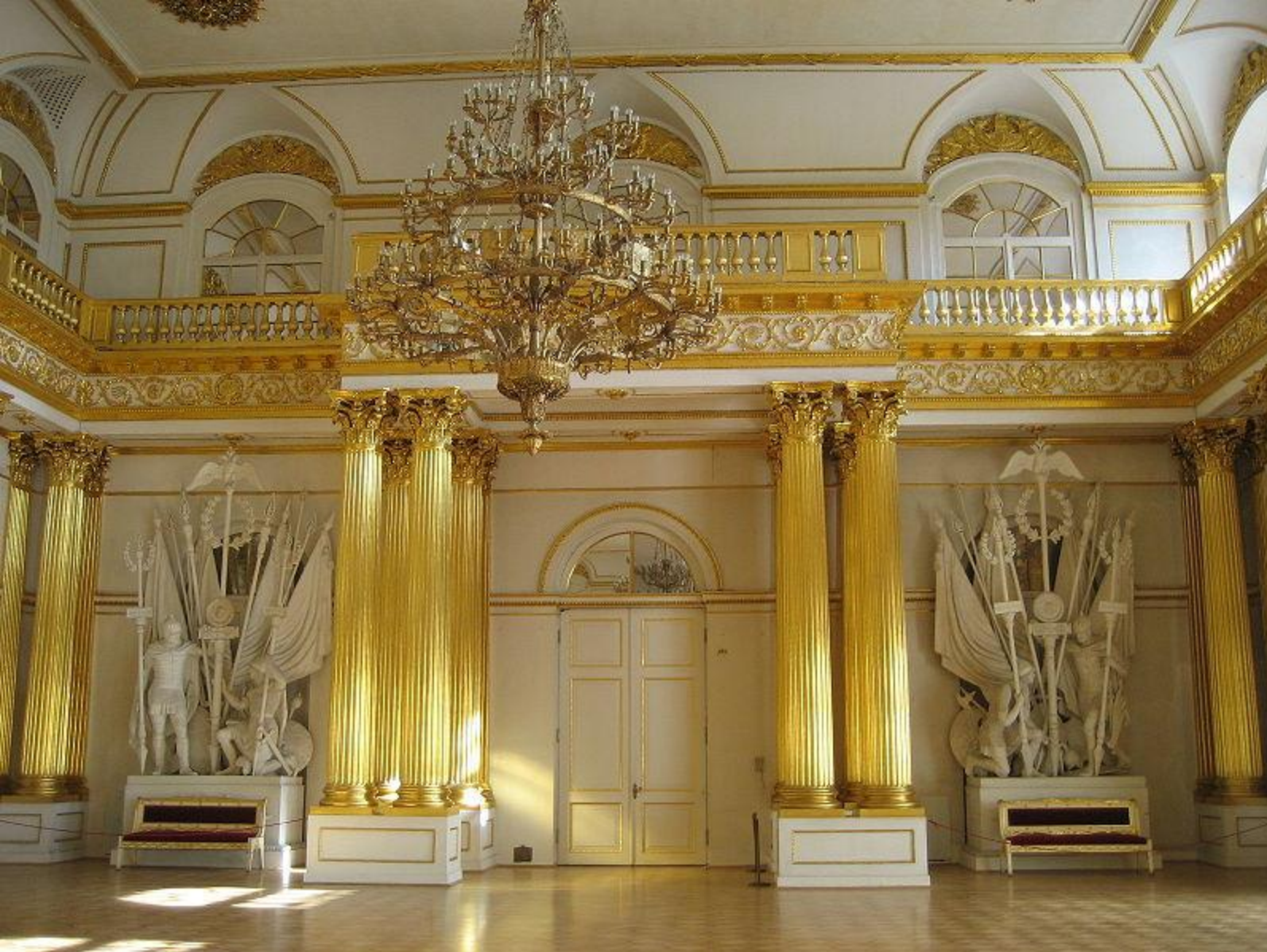
Зал в классическом античном стиле в Зимнем Дворце