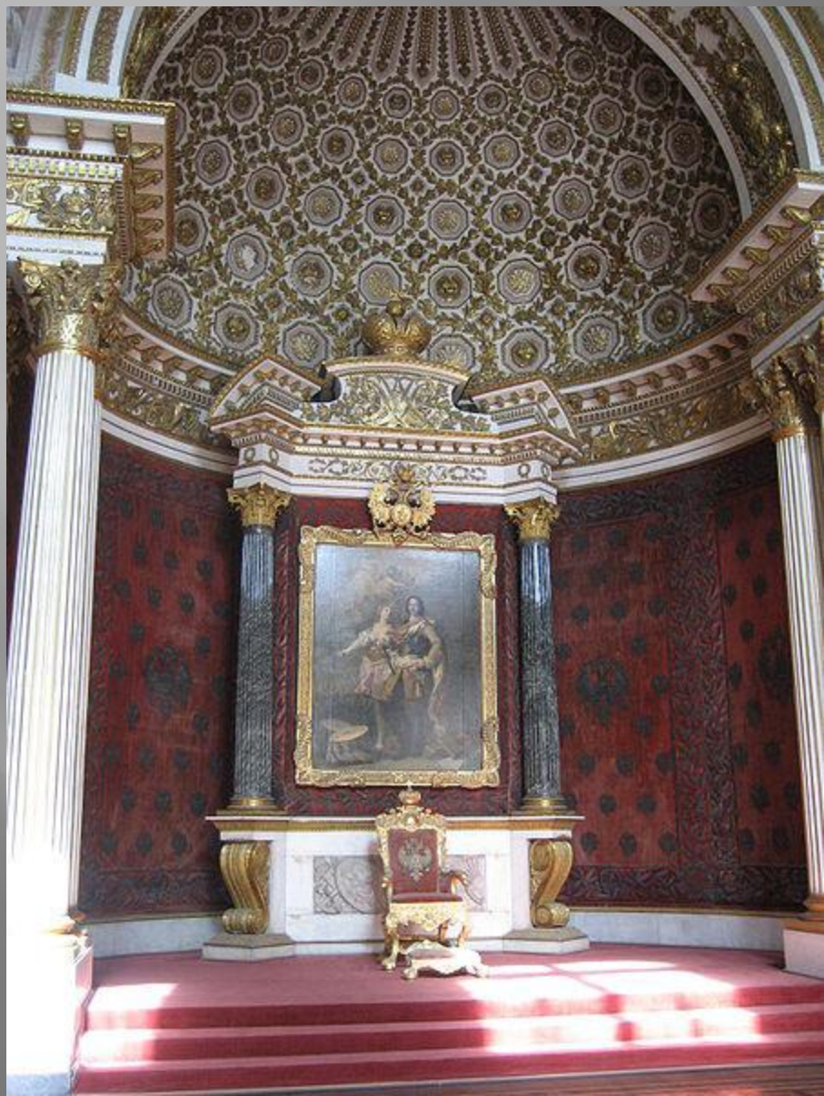
Тронный зал Петра I в Зимнем Дворце