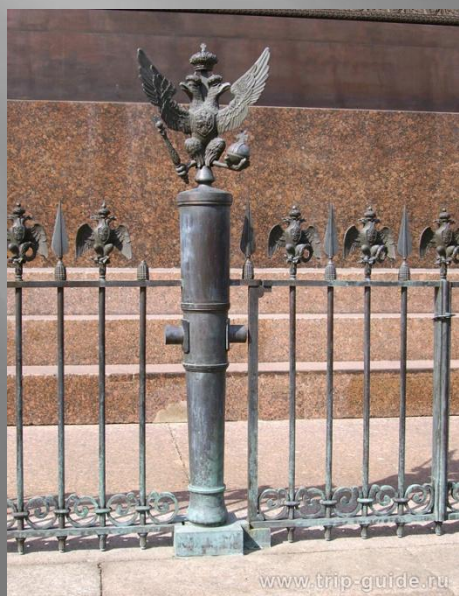
Ограда Александровской колонны