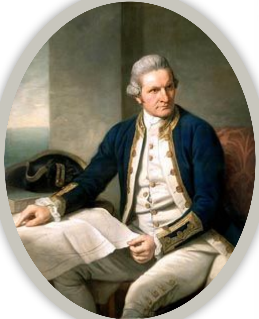
Капитан Джеймс Кук позировал для этого портрета в Лондоне 25 мая 1776 года. Художник Натаниэл Дэнс

Британский мореплаватель, крупнейший исследователь Океании, первый исследователь антарктических морей.