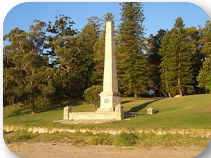
Обелиск, посвящённый Джеймсу Куку в Карнеле (пригород Сиднея)