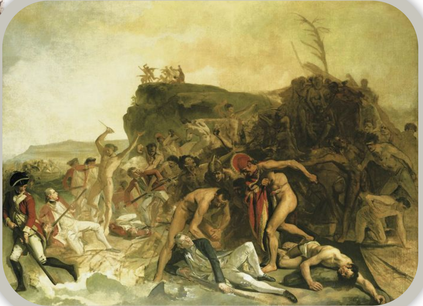
«Гибель капитана Кука»