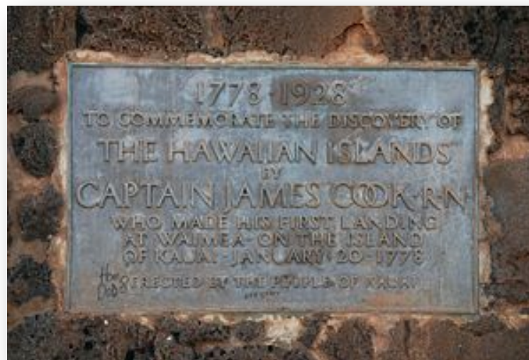
Надпись на обратной стороне мемориала капитана Джеймса Кука, Ваимиа, о. Кауаи (Гавайские о-ва)