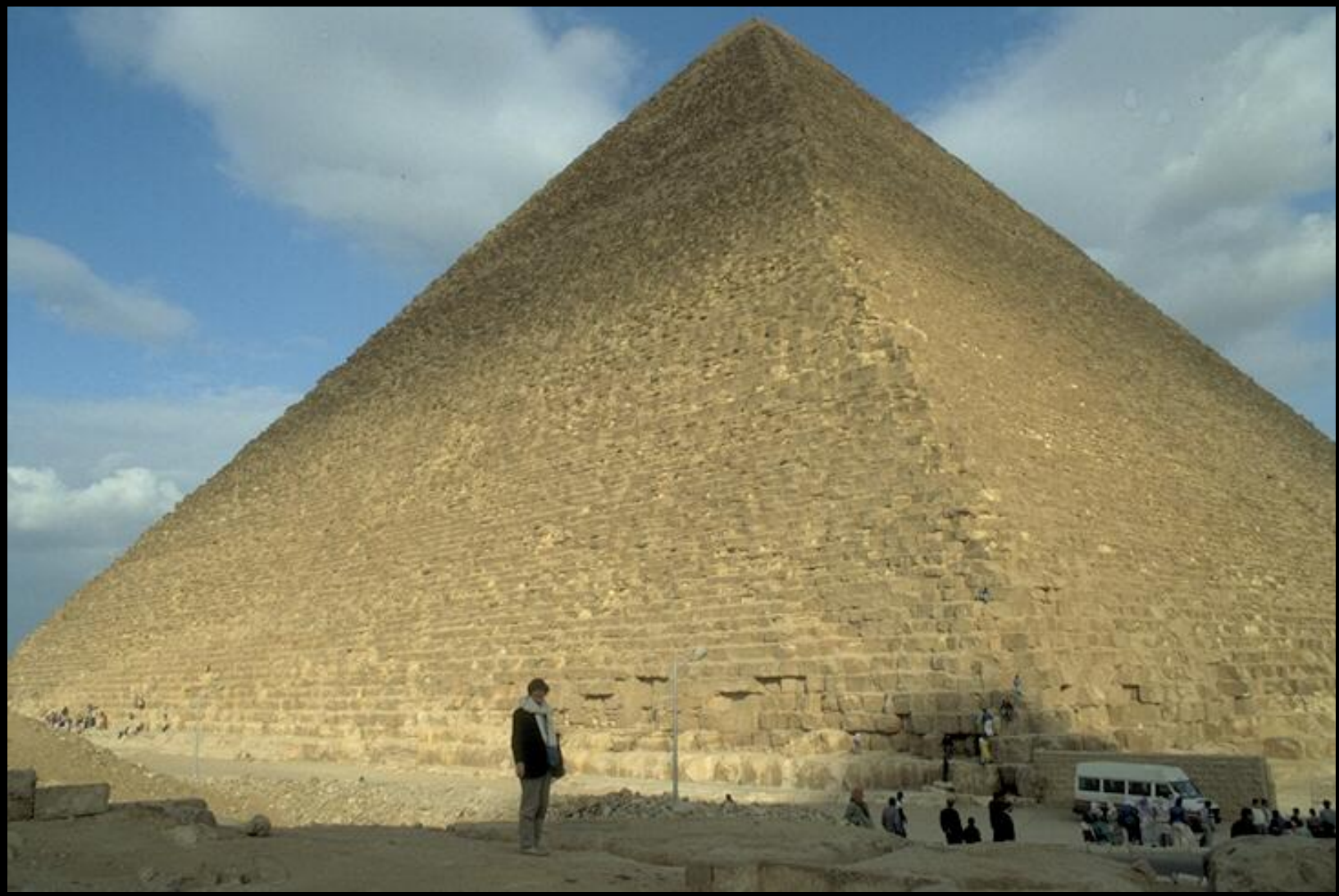
"Горизонт Хуфу" - так называется пирамида Хеопса.