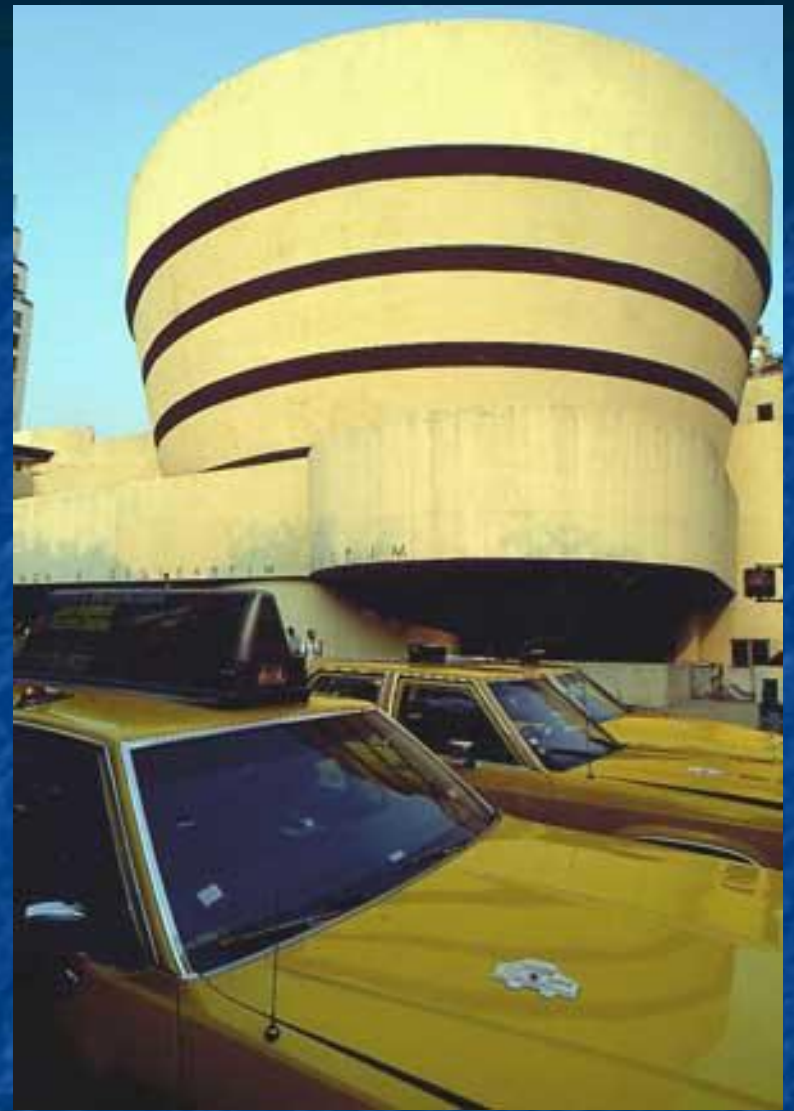
Музей Гуггенхейма в Нью-Йорке