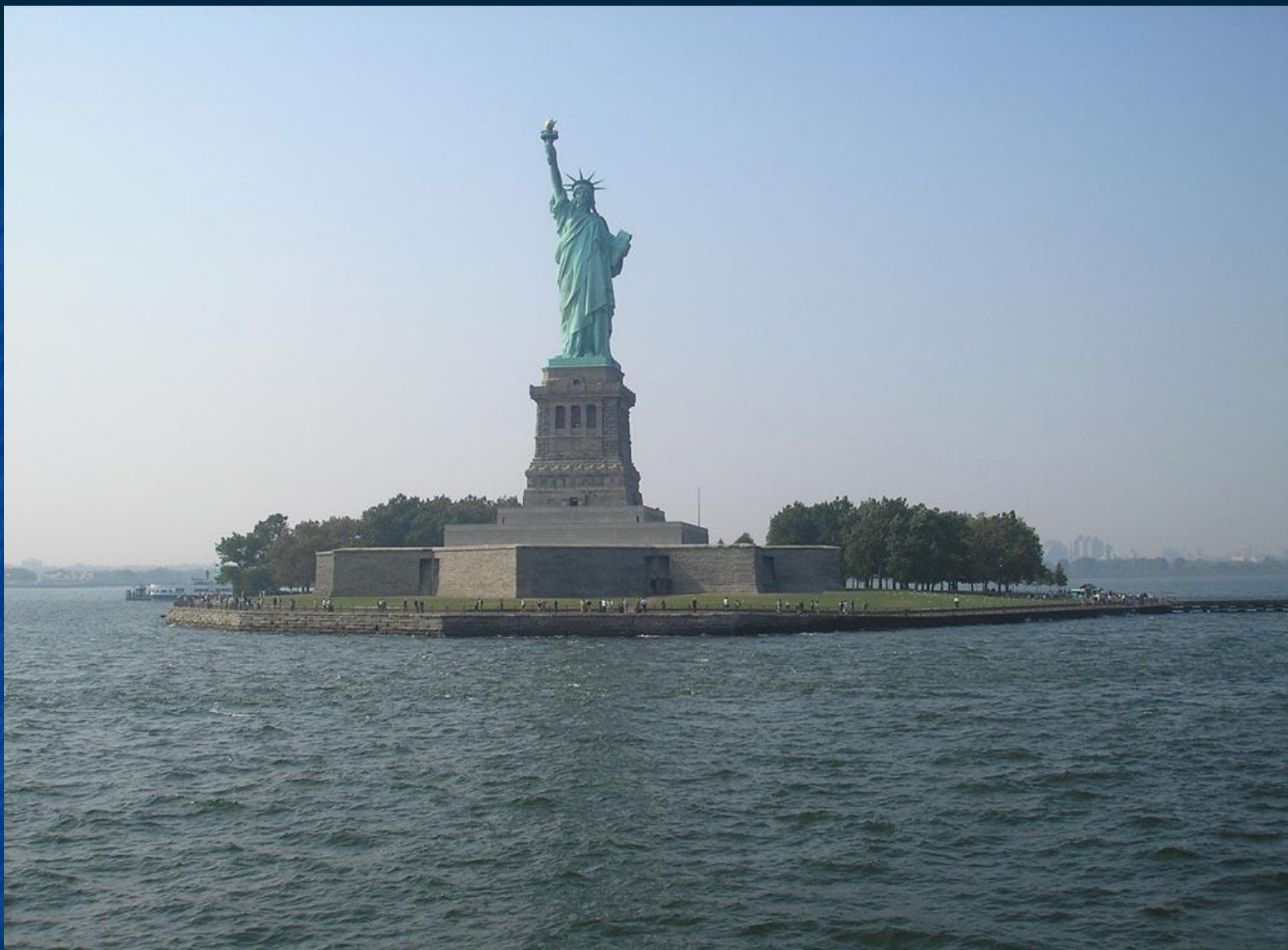
Знаменитая статуя Свободы