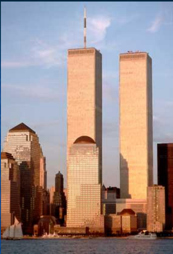
ВСЕМИРНЫЙ ТОРГОВЫЙ ЦЕНТР в Нью-Йорке (был уничтожен террористами 11 сентября 2001)