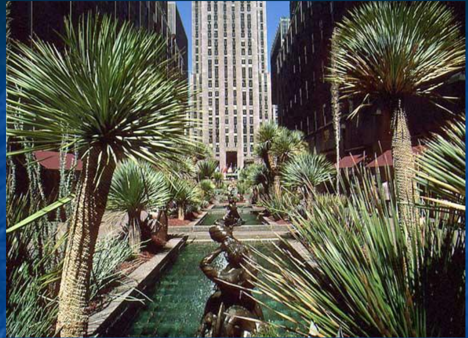
РОКФЕЛЛЕРОВСКИЙ ЦЕНТР - комплекс небоскребов и площадей в Манхаттане между 5-й и 6-й авеню и 48-й и 51-й улицами.