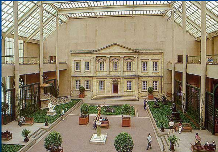
Один из залов музея Метрополитен