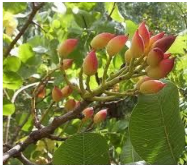
Фисташка туполистная - Pistacia vera .