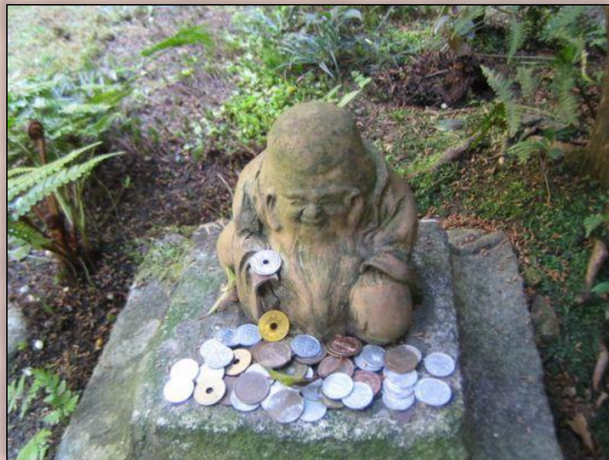
Рисунок этот сопровождал статью о финансовом положении Японии, о том, что она стала главным кредитором в мире.

Маленький человечек с раскосыми глазами восседал на куче денег. С гордостью и удивлением взирал он на обступивших его людей, которые, протягивали к нему руки, просили: «Дай! Дай!». Это представители разных континентов. Лица у них то белые, то смуглые, то совсем темные, волосы тоже разные: американским ежиком, то по-африкански курчавые.