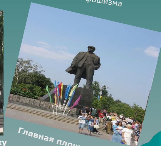
Главная площадь г. Донецка