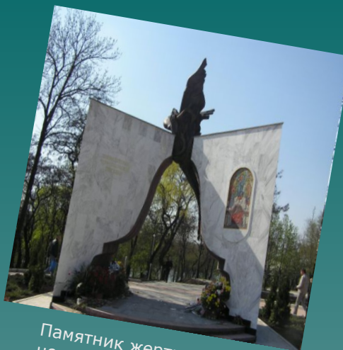
Памятник жертвам чернойбыльской катастрофы