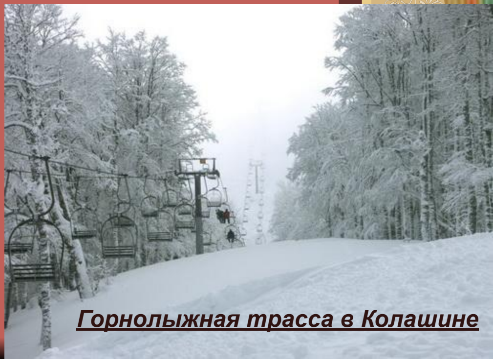
Горнолыжная трасса в Колашине