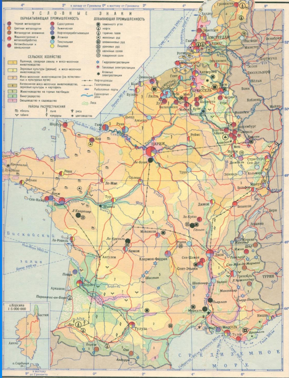
Масштаб 1:5 000 000 (в Гсм 50 км) 0 50 100 150 200 км