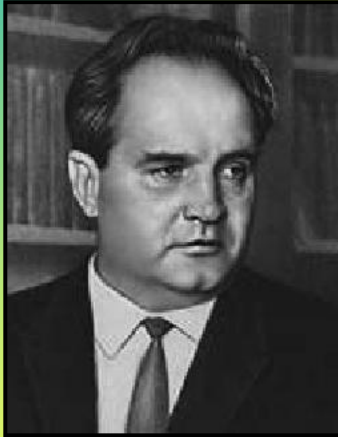
Сергей Сергеевич Наровчатов

В честь какого знаменитого академика названа одна из улиц города?