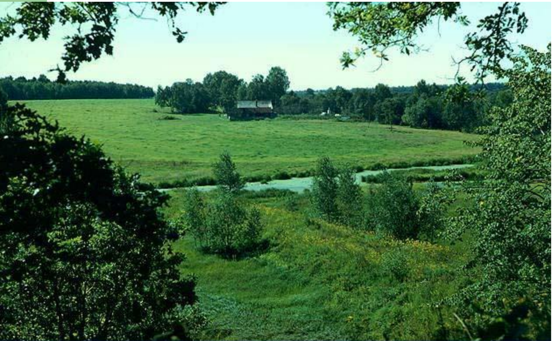
Русская равнина. Река Пра в Мещере.