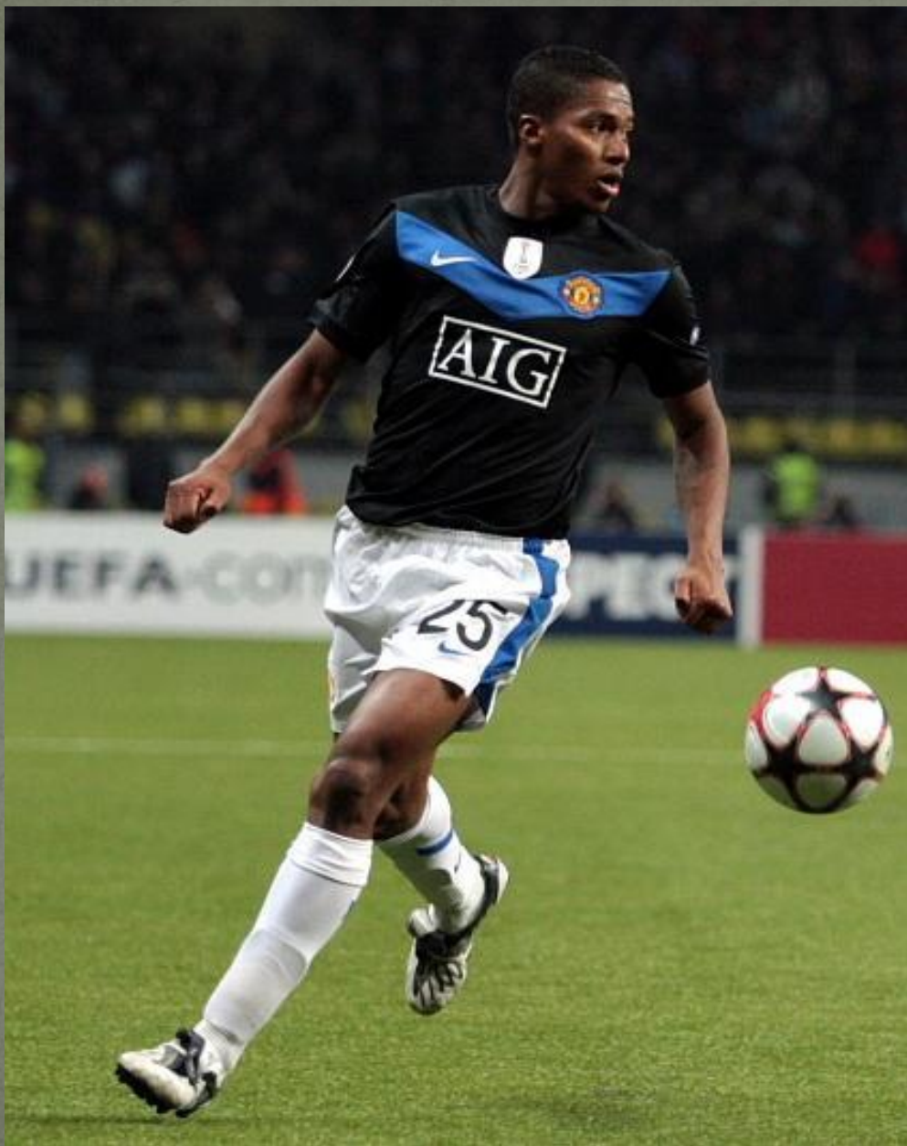
Луїс Антoніо Валенсія