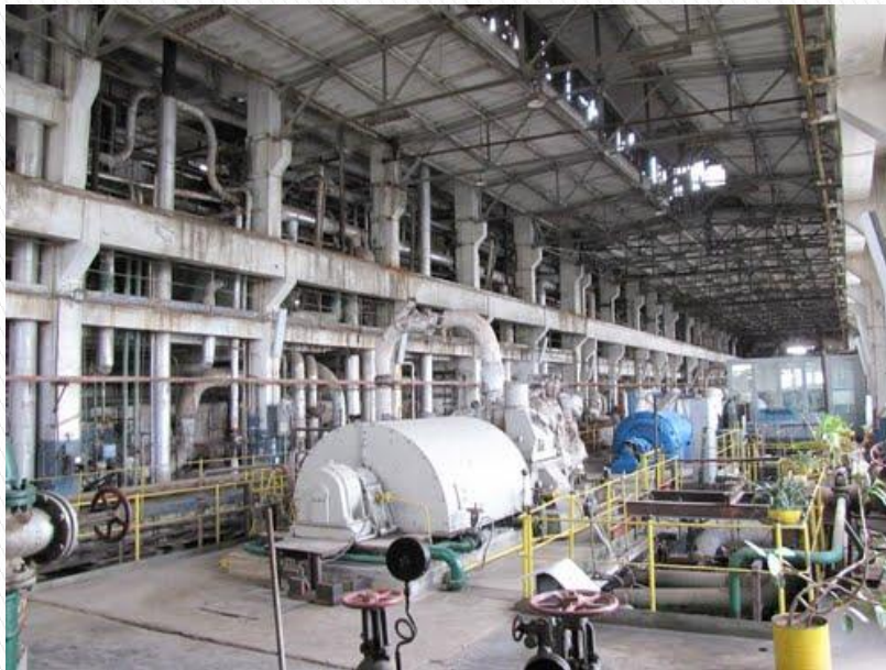
Розділ ТЕЦ, Турбінне відділення