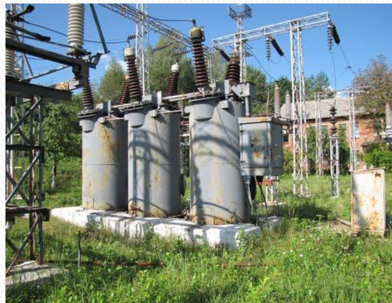
Новий Розділ ТЕЦ, Олійний Вимикач 110кВ