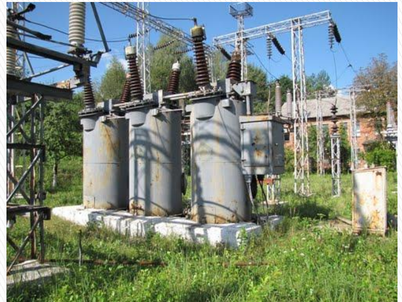
Новий Розділ ТЕЦ, Олійний Вимикач 110кВ