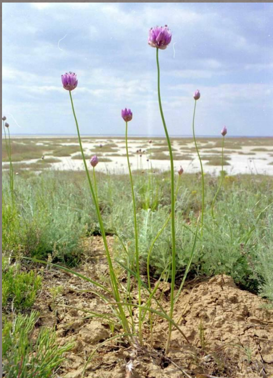
● Лук индерский