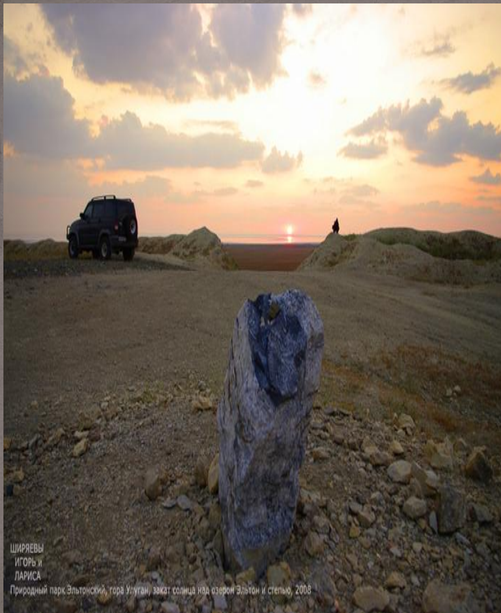
ШИРЯЕВЫ ИГОРЬ И ЛАРИСА Природный парк Эльтонский, гора Улуган, закат солнца над озером Эльтон и степью, 2008