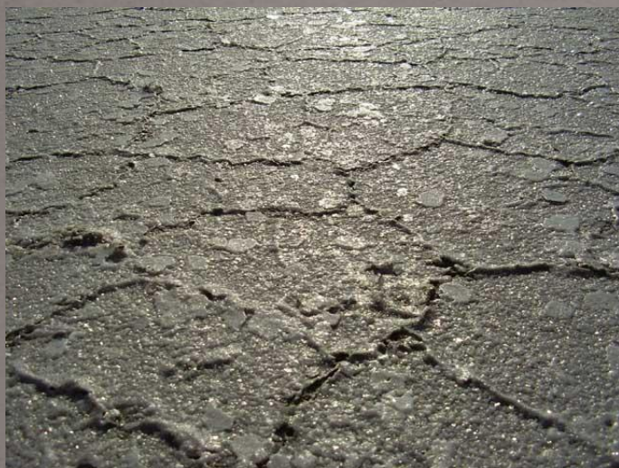
Грязь на озере Эльтон