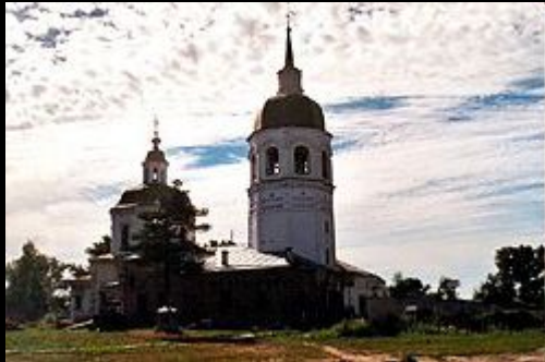
Церковь Преображения Спасителя, около 1750

Енисейск долгое время был культурным центром Енисейской губернии.