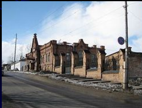
Аптека в Енисейске

Енисейск был крупным центром иконописного искусства. В 1669 году в городе работали пять иконописцев. В 1760 — 1780-х годах были известны енисейские иконописцы Григорий Кондаков и Максим Протапопов.