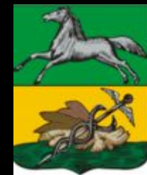
Герб 1804 года